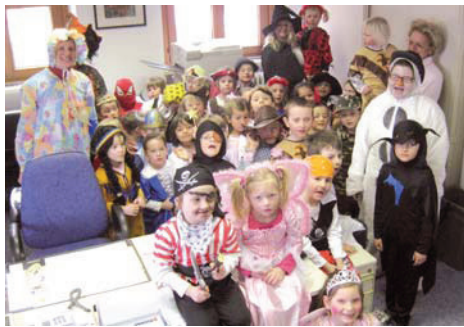
Die Kindergartenkinder zu Besuch am Rosenmontag im Gemeindeamt