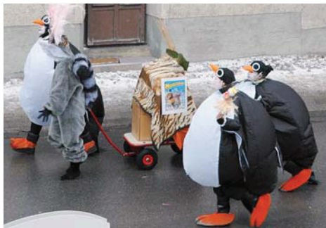
Weiberfasching am Unsinnigen Donnerstag in Maurach