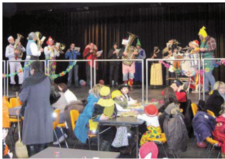
Kinderfaschingsparty im Gemeindezentrum veranstaltet von der Landjugend Eben