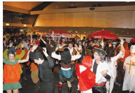
Faschingsparty der FF Eben