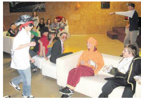
Faschingsparty bei YoungVillage im Jugendraum in Maurach