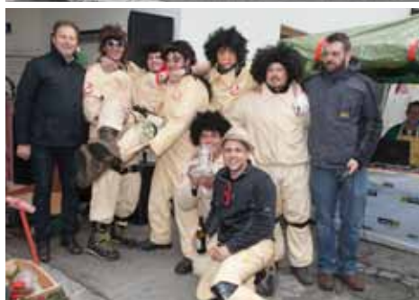
2. Platz Ghost Busters