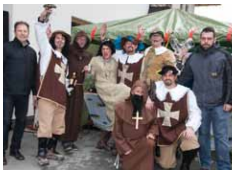
1. Platz Robin Hood

Am 05. Dezember 2013 veranstalteten wir in Zusammenarbeit mit den Inferno Diabolus den Nikolausumzug in besinnlicher Atmosphäre in Wiesing. Wir durften uns über zahlreiche Besucher und strahlende Kinderaugen freuen. Der Reinerlös wurde dem Verein WIR in Wiesing gespendet.