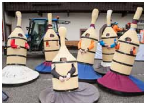
3. Platz Stockschützen

Am 21. Dezember 2013 veranstalteten wir erstmalig, wieder in sehr guter Zusammenarbeit mit den Inferno Diabolus, den Wiesinger Adentsmarkt. Die unterschiedlichsten Verkaufsstände, die traditionelle Hausmannskost und das Rahmenprogramm, besonders für unsere Kleinen, fanden großen Anklang bei den Wiesingern und den zahlreichen Besuchern.