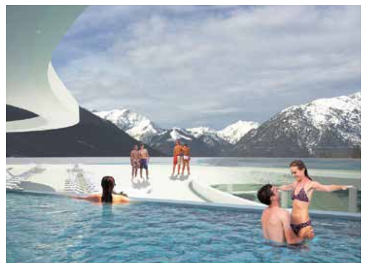
Dachterrasse Atoll Achensee