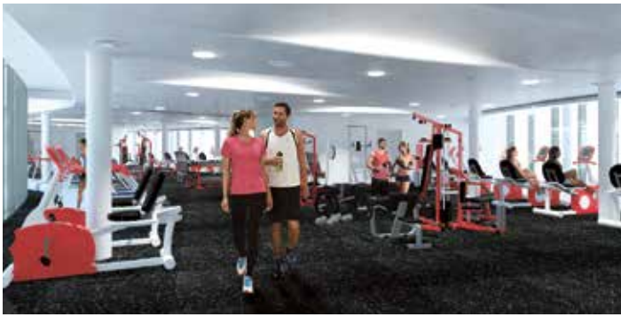
Panorama-Fitness-Studio Atoll Achensee