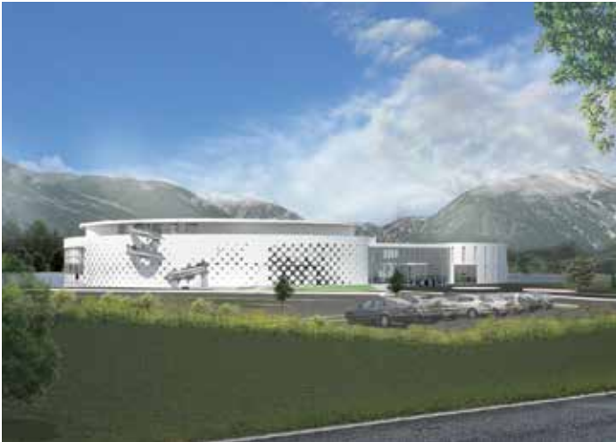
Blick von der Strasse zum Atoll Achensee