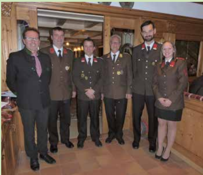
Das neue Kommando der Freiwilligen Feuerwehr Eben am Achensee.

Die Feuerwehr Eben möchte auch den Beförderten und der neuen Führung gratulieren und wünscht ihnen viel Kraft und Erfolg für ihre neuen Aufgaben.