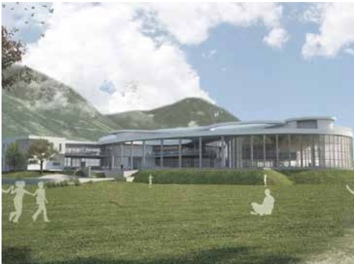
Blick vom See zum Atoll Achensee