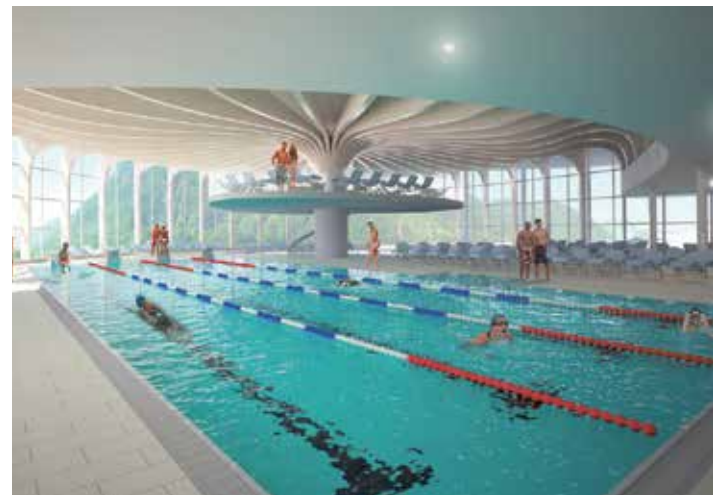
Schwimmhalle Atoll Achensee