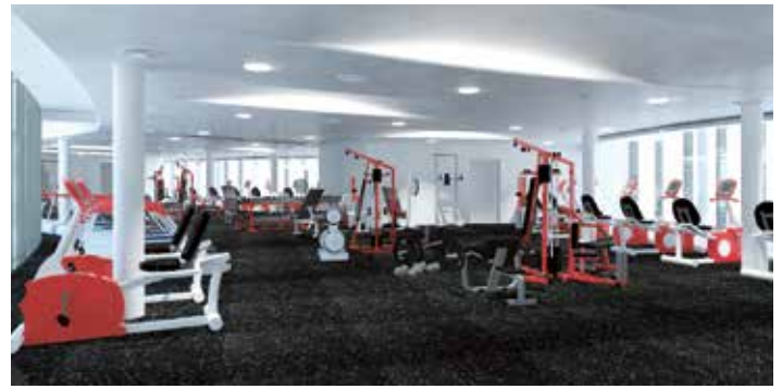
Panorama-Fitness-Studio Atoll Achensee