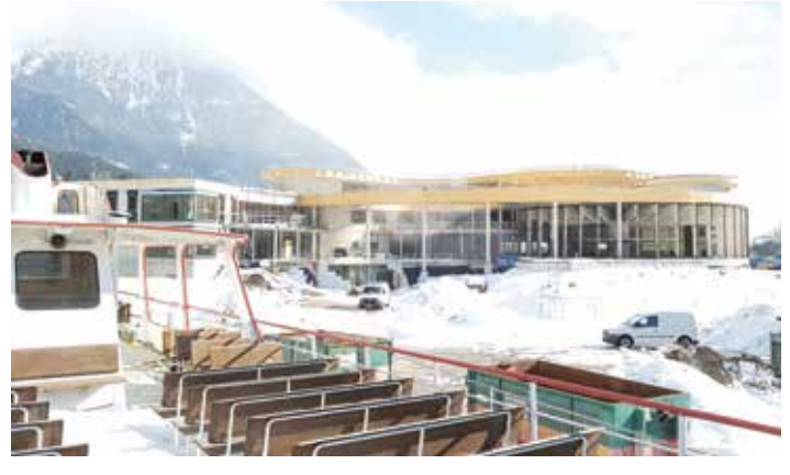
Aktuelles Bild der Baustelle