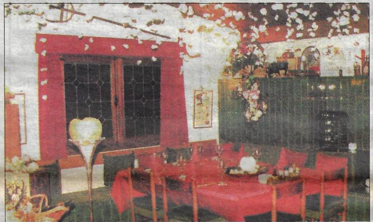
Decoración navideña de la Casita Suiza - Weihnachtsdekoration

Ich hatte Euch ja schon ihr neues Lokal angekündigt, das sie vor vier