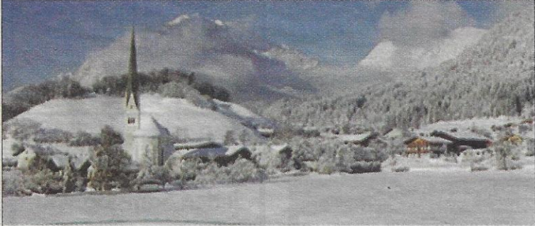
El pueblo Wiesing en la nieve - Wiesing im Schnee

a las 9 de la mañana y con una oferta de desayunos acojonante. Croissants crujientes, huevos preparados de todas las maneras. Panecillos calientes del horno, mermeladas, embutidos y todo lo que le apetece al estómago. Es decir, a partir del sábado la mejor dirección para el desayuno es "Pizza Pronto Burger Fast Food Restaurant".