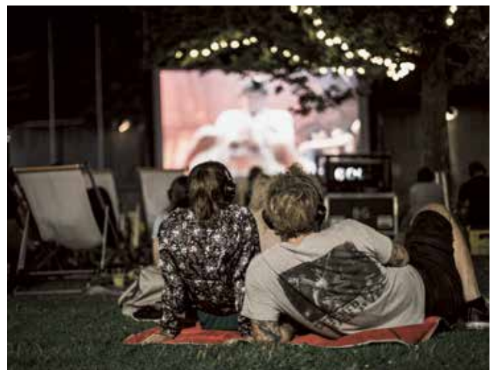
Silent Cinema, © Jenny Haimerl Fotografie

Die Veranstaltung findet nur bei schönem Wetter statt! Ersatztermine sind Freitag, 26. und Samstag, 27. Juli 2019 . (Eine Verschiebung wird spätestens zwei Tage vor Veranstaltungsbeginn bekannt gegeben).