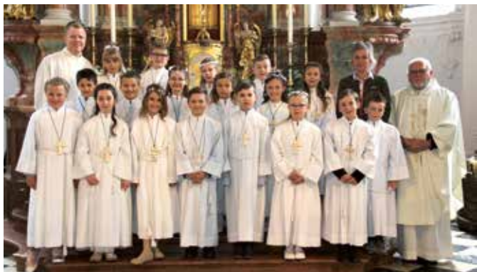
Heilige Kommunion in Eben

Am Sonntag, 19. Mai haben 18 Kinder das Fest der Heiligen Kommunion in Eben in Maurach am Achensee gefeiert. Wir danken allen, die in irgendeiner Art und Weise zum Gelingen des schönen Festes beigetragen haben. Vor allem bedanken möchten wir uns bei dem Schülerchor der Volksschule Eben.