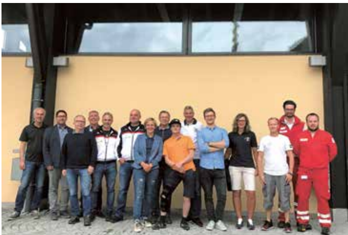
Vereinsobleute - Treffen der Achenseer Vereine

MitarbeiterInnen können sich mit der DahoamCard (kostenlos bei der Gemeinde erhältlich) und dem Geburtsdatum bei joblife.achensee.com anmelden. Nachdem man sich seinem/r Arbeitgeber/in zugeordnet hat, ist die volle Version verfügbar und die Events und Kurse für MitarbeiterInnen sind direkt und unkompliziert buchbar. (Es sind alle ArbeitgeberInnen auswählbar, die sich auf der Job-Life Achensee angemeldet haben und bestätigt haben, die Grundwerte eines Triple-A-Arbeitgebers zu leben.)