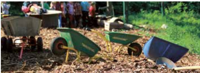
kostenloser Rindenmulch am Waldplatz für dem Waldkindergarten Moosbett

Der Waldkindergarten Moosbett und der Hort Mosaik 4.14 des Kinderreich Maurach möchten sich herzlich bei der Firma Hussl Gartengestaltung für die kostenfreie Begrünung unserer neuen Terrasse bedanken! Auch aufwendige Rankhilfen wurden für die Kletterpflanzen installiert. Die Pflanzen werden schön grün und spenden uns bald Schatten bzw. Sichtschutz. Zudem haben wir noch eine große Ladung Rindenmulch gratis zur Verfügung gestellt bekommen. Die gesamte Arbeitszeit, Material und Pflanzen wurden uns von der Firma Hussl spendiert.