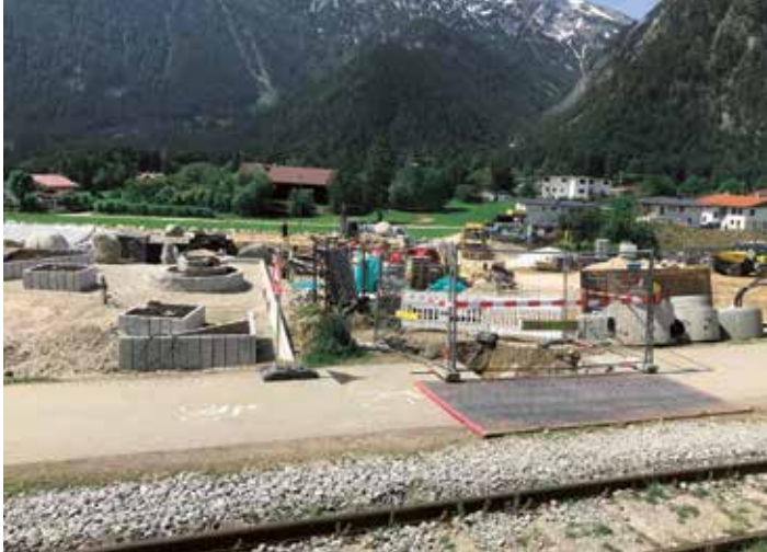
Kanalarbeiten mit Stand am 14. Juni 2019

Da der seit vielen Jahrzehnten bestehende Kanalstrang zwischen der Dorfstraße und dem Feldererweg in desolatem Zustand ist, wird derzeit eine neue Leitung verlegt. Die Arbeiten begannen Mitte Mai und sollen bis Ende Juli 2019 abgeschlossen werden. Da zeitgleich das Hotel Alpenrose im dortigen Bereich die Gartenanlage (Schwimmteiche mit Liegeplätzen usw.) erweitert, ist die Baukoordination besonders gefordert. Die Kanaltrasse quert die Gleise der Achenseebahn und es ist diesbezüglich eine Stahlrohrpressung beauftragt.