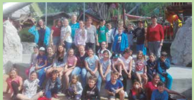
MinistrantInnen im Freizeitpark

Danke an alle Begleiterinnen und alle Eltern, die den Ministrantendienst unterstützen. Wir sind froh, dass wir auch heuer in allen Pfarreien neue MinistrantInnen bekommen. Nochmals herzlichen Dank an alle Minis, die einen so wichtigen Dienst machen.