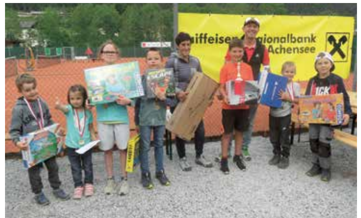
Tolle Preise gab es für die GewinnerInnen vom Spielefest 2019