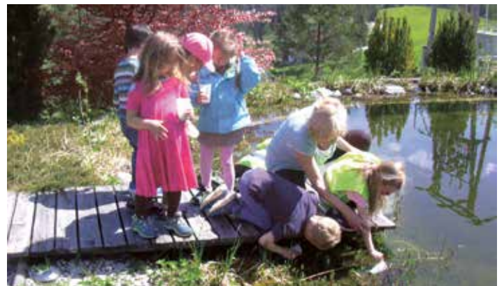
Die Kinder beim Wasserproben entnehmen

Anhand der Rückstände im Filter können die StudentInnen und ProfessorInnen bestimmen, welche Tiere sich im Wasser aufhalten. Wir sind schon gespannt auf die Rückmeldung der Universität für Ökologie. Auch die Kindergartenkinder kontrollierten eine Woche später, ob sich die Kaulquappen in diesem Teich gut entwickelten.