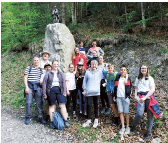
Firmlinge aus Eben und Pertisau beim Dien-Mut-Weg in Pertisau

Danke an alle Eltern und BegleiterInnen, die in irgendeiner Weise für eine gelingende Vorbereitung beigetragen haben.