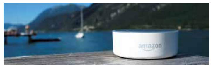
Amazon Echo Dot

Mit den digital verfügbaren Achensee-Wandernadeln über die App „SummitLynx“ ( www.summitlynx.com ) erfolgt eine weitere Neuerung im Digitalbereich. Seit Jahrzehnten sind Wandernadeln eine beliebte Errungenschaft besonders fleißiger WanderInnen, die erst ab einer bestimmten Anzahl absolvierter Wanderungen ausgegeben werden. Am Gipfel angekommen nimmt die App dank Geotagging nun ganz von selbst den Eintrag ins Smartphone vor.