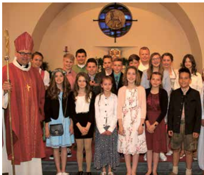
Firmlinge aus Eben und Pertisau