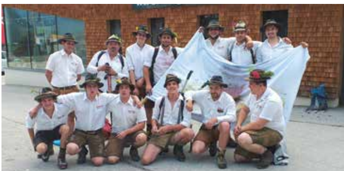
Die Mauracher-Feuerbrenner sagen allen Sponsoren und Gönnern wieder ein herzliches Dankeschön