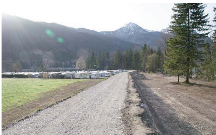
Bauvorhaben Schutzdamm Oberaubach – Fertigstellung Frühjahr