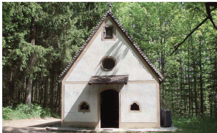
Die Wanderung führt vorbei an der Grünangerkapelle

mehreren Verpflegungsstationen verwöhnt. Die Stationen sind von 10.00 bis 12.00 Uhr besetzt. Die gemütliche Wanderung dauert ca. 1 Stunde. Mehr wird aber noch nicht verraten – lassen sie sich überraschen! Unser Ziel ist das Gasthaus Waldruh, wo sie musikalisch empfangen werden. Um ca. 13.00 Uhr gibt es dann eine große Tombola mit zahlreichen tollen Preisen aus der Region. Jeder Teilnehmer, der einen Wanderpass vorweist, nimmt automatisch an der Verlosung teil. Auf eure Anmeldung freut sich der