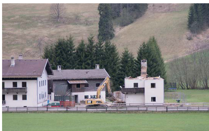
Abbrucharbeiten „Alte Urschnerhäuser“