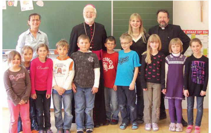
Der Weihbischof zu Besuch bei den Volksschülern