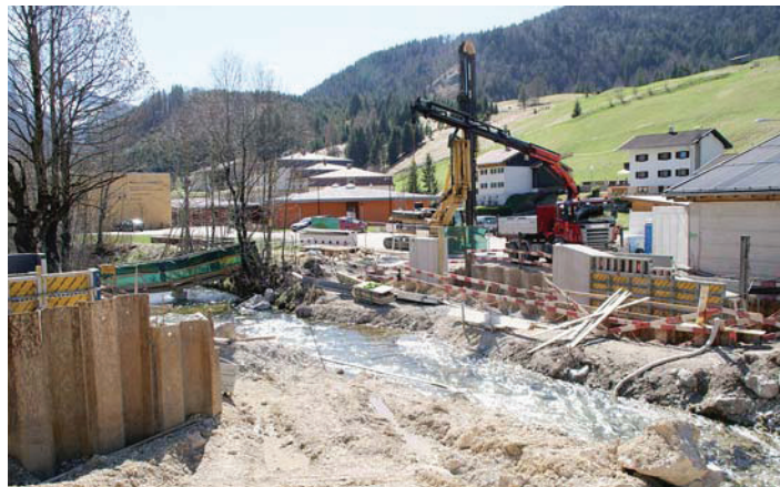
Bauvorhaben Neubau Dollnmühlebrücke – Fertigstellung Juni/Juli