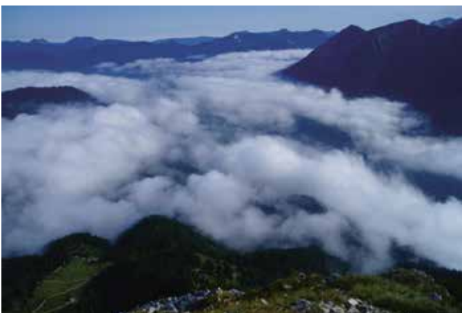
Blick von der Seekarspitze auf Achenkirch

Die für September d. J. geplante Bergmesse der Bergrettung Achenkirch musste leider aus terminlichen Gründen verschoben werden. Sie findet nunmehr am 11. Oktober um 11:00 Uhr am Gipfel der Seekarspitze statt. Die Bergrettung Achenkirch würde sich über zahlreiche Teilnahme freuen.