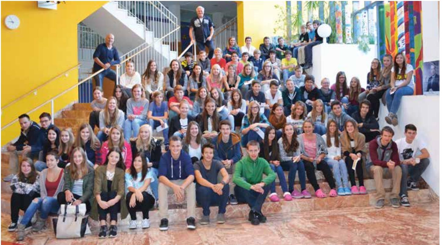
SchülerInnen der 4. Klassen mit den „Ehemaligen“.

Die erste Schulwoche der Viertklässler stand in der NMS-Achensee wieder ganz im Zeichen der Berufsorientierung. Am Mittwoch, 09. Sept., wurde die „Berufssafari“ der Wirtschaftskammer im WIFI besucht. Dort konnten die Schülerinnen und Schüler sechs verschiedene Berufsfelder kennen lernen.