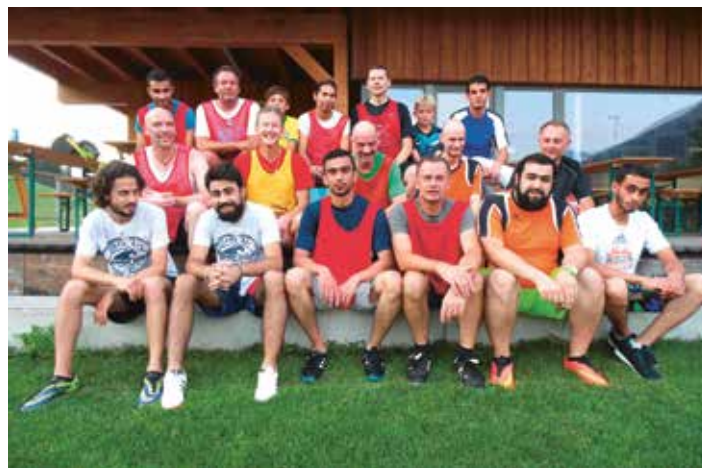
Altherren Achenkirch mit den Asylwerbern aus Maurach

Die ‚Altherren‘ aus Achenkirch spielen mit den syrischen Asylwerbern aus Maurach Fußball – ein sehr schönes Zeichen, gelebter Integration.