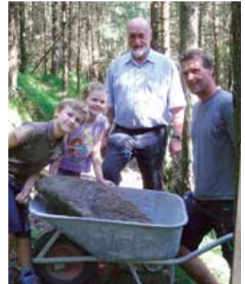
Der ca. 80 kg schwere Stein ist geborgen.