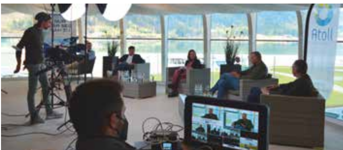
Erste virtuelle Pressekonferenz von Achensee Tourismus zum Literaturfestival „achensee.literatour“.