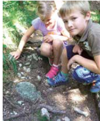
Der Stein schaut nur mit der Spitze aus dem Boden.