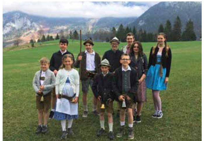
Zehn Mädchen und Buben haben dieses Jahr beim „Grasausläuten“ den Winter vertrieben.

Am Samstag, dem 1. Mai 2021, war es wieder soweit! Steinberger Mädchen und Buben machten sich auf den Weg, den traditionellen Brauch des Grasausläutens zu pflegen. Dabei sollte wie immer der Winter vertrieben und das Gras „geweckt“ werden. Mit einem sinnigen Gedicht wurde auch den Bewohnern Steinbergs einmal mehr Glück und Segen für Haus und Hof gewünscht. Vielen Dank an alle Kinder und Jugendlichen für ihren tollen Einsatz!