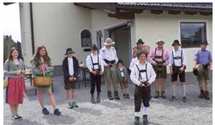
Die jungen Grasausläuter beim diesjährigen Winteraustreiben.

Auch heuer haben sich die Grasausläuter mit ihren Glocken und Schellen wieder auf den Weg gemacht, den Winter zu vertreiben. Bei allen, die ihnen dabei ihre Türen geöffnet haben, möchten sie sich herzlich bedanken. Die Gemeinde wiederum bedankt sich bei allen, die jedes Jahr losziehen und das Grasausläuten pflegen, damit dieser besondere Brauch nicht in Vergessenheit gerät.