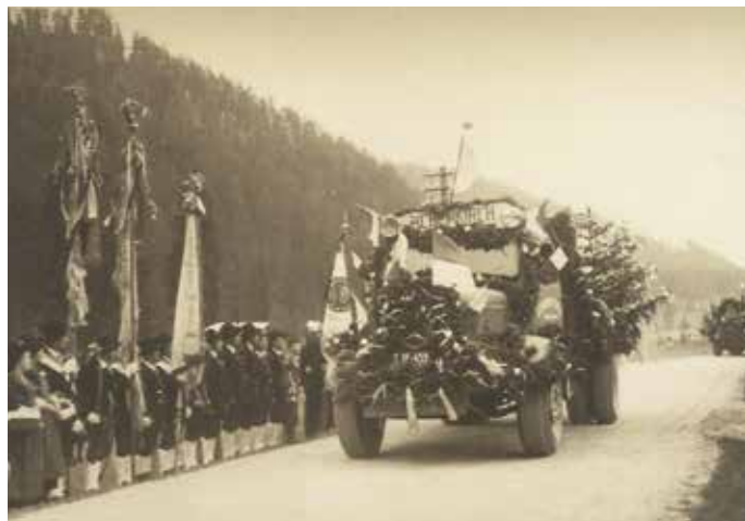
Vereine und Formationen heißen die Glocken in Achenkirch willkommen.