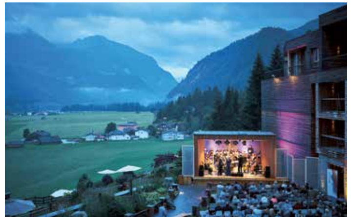
KLASSIK.UNIQUE im Hotel DAS KRONTHALER

Das nächste KLASSIK.UNIQUE.-Wochenende im DAS KRONTHALER findet vom 10. bis 12. Juli 2020 statt