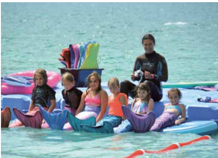
ORF Sommerfrische: Meerjungfrauenschwimmen am Achensee

Am Freitag ging es in Pertisau neben der Schifffahrt um die E-Mobilität. Probefahrten mit E-Autos und E-Bikes waren ebenso möglich wie eine Fahrt mit einem der Schiffe der Achenseeschiffahrt. Auch für Kinder war mit einer großen Hüpfburg und Kinderschminken einiges geboten.