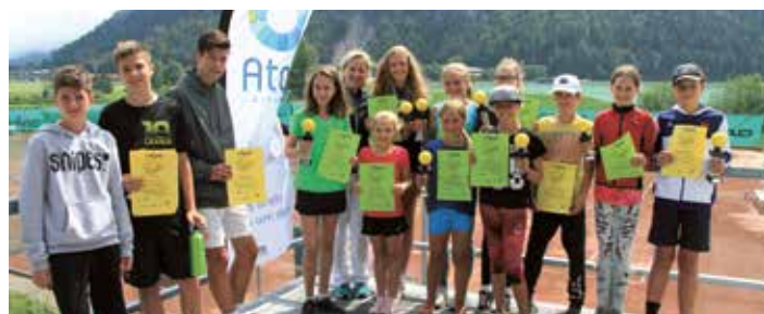
Kinder- und Jugendcup