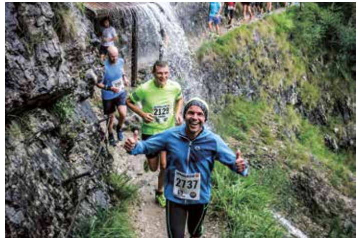
Österreichs schönster Panoramalauf, © sportograf

Zum 20. Jubiläum erhält jede 20. Anmeldung für den 23,2 Kilometer langen Hauptlauf (Sonntag) ihr Startgeld wieder zurück.