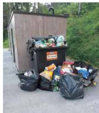
Mülldepot am Achensee Ufer

Die Gemeinde Eben versucht bei der Müllentsorgung und -trennung bestmöglich zu informieren und zu unterstützen: nicht nur die wöchentliche Biomüll- sowie die 2-wöchige Restmüllsammmlung, auch der Recyclinghof steht an den Öffnungszeiten zur fachgerechten Müllentsorgung bereit. Wissenswertes rund um Müllabfuhrtermine, Mülltrennung, etc. kann auch online unter www.eben.tirol.gv.at sowie über die kostenlose Gemeinde App gem2go abgerufen werden.