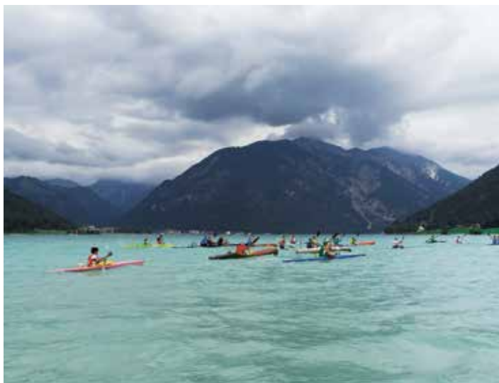
Kajakrennen am Achensee

Der Kajakverein Achensee bedankt sich bei allen Sponsoren, die uns wieder mit Preisen unterstützt haben, insbesondere bei der Edelbrennerei Kostenzer für die exklusiven Hauptpreise.