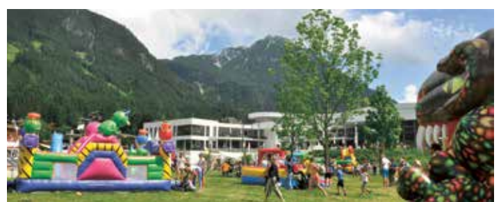
Familienfest im Atoll Achensee

Bei freiem Eintritt konnten sich knapp 1.500 Erwachsene und Kinder an 12 verschiedenen Hüpfburgen oder beispielsweise einer spannenden Familienolympiade ausprobieren.