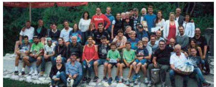
Golf- und TennisspielerInnen