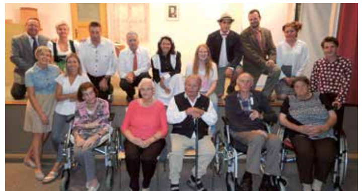
Einen lustigen Abend erlebten auch die BewohnerInnen vom Haus am Annakirchl. Herzlichen Dank für die Einladung von der Heimatbühne Achenkirch