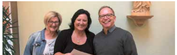
Übergabe des Honorars an das Team im Alten- und Pflegeheim