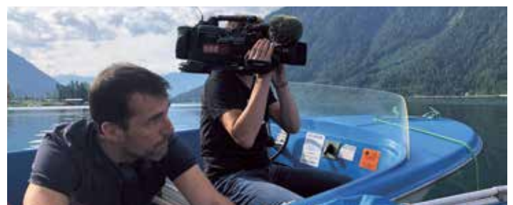
Dreharbeiten zu „9 Plätze - 9 Schätze“

Auf der diesjährigen Suche nach dem schönsten Platz Österreichs geht es Anfang Oktober in die Bundesländer Ausscheidung. Die Region Achensee wurde zur bundeslandweiten Vorauswahl eingeladen und versucht natürlich diese zu gewinnen. Die jeweiligen Sieger gehen am Nationalfeiertag für ihr Bundesland in „9 Plätze - 9 Schätze“ live im ORF an den Start.