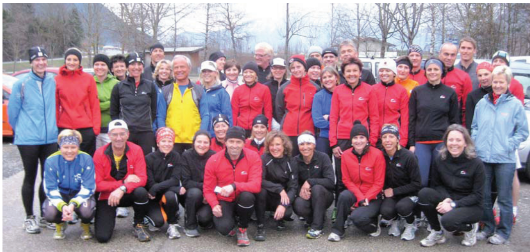
Das Laufteam Achensee startete am Dienstag, den 13. April 2010 unter dem Motto „Es gibt kein schlechtes Wetter“ mit vielen begeisterten LäuferInnen in die neue Laufsaison 2010.