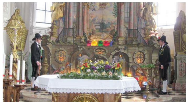
Am Karsamstag waren die Männer der Schützenkompanie Eben-Maurach wieder im Einsatz. Sie wechselten sich bei der Grabwache stündlich von 9.00 bis 19.00 Uhr ab. Das Heilige Grab wurde wieder von den Schützen aufgestellt, sodass es die Gläubigen über die Osterfeiertage bewundern konnten.