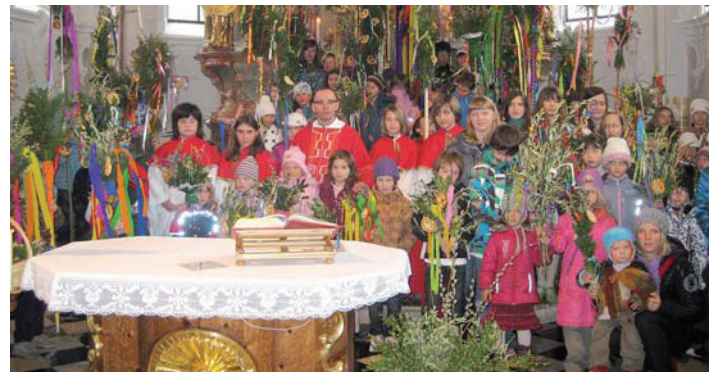
Viele Kinder und Jugendliche kamen am Palmsonntag in die Notburgakirche nach Eben um ihre Palmsträuße und Palmstangen zu weihen.