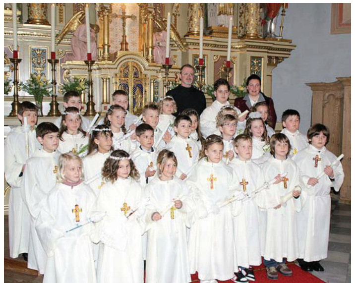
Erstkommunion der Achenkircher Kinder am Sonntag den 11. April 2010