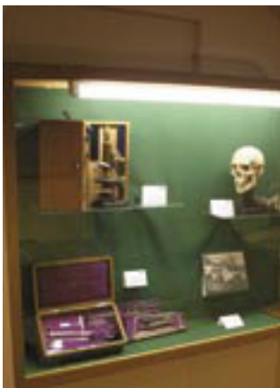
Das Museum ist jedenfalls einen Besuch wert – im Bild eine Vitrine der Gerichtsmedizin Innsbruck.