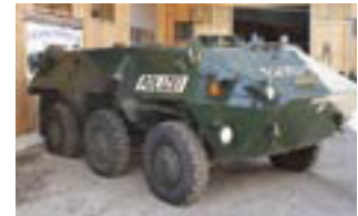
Der einzige Polizeipanzer Österreichs steht nun in Maurach!