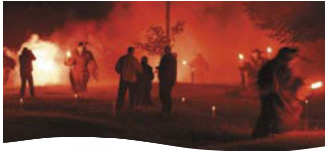
Botschafter Abend mit Zwischenstopp auf der Gaisalm: Nächtlich-mystische Atmosphäre mit der „schauerlichen“ Erzählung der Achensee-Sage

Viele Gäste verbringen Jahr für Jahr mit großer Begeisterung ihren Urlaub in ihrer „zweiten Heimat“. Die Region bedankte sich unlängst bei diesen treuen Achensee-Liebhabern – mit der 12. Stammgästewoche, zahlreichen Auszeichnungen und der Ernennung neuer „Botschafter des Achensees“. Zu vielen treuen Stammgästen haben sich inzwischen herzliche Freundschaften entwickelt, und dass diese begeisterten Gäste die besten „Werbeträger“ für ihre Urlaubsregion sind, versteht sich von selbst.