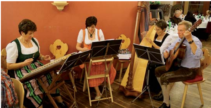
Auch unsere Mitbewohner und Bediensteten im Haus am Annakirchl verstehen sich im Feiern. Die Weihnachtsfeier wurde musikalisch von der Gemeinde Steinberg am Rofan gestaltet.