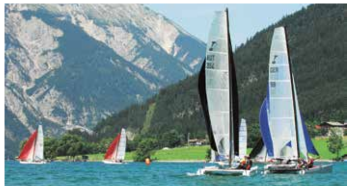
Der Segelsommer 2023 am Achensee bringt eine Vielzahl an Regatten. Ein Höhepunkt wird die Europameisterschaft im Tornadosegeln vom 18. bis 23. Juli sein.