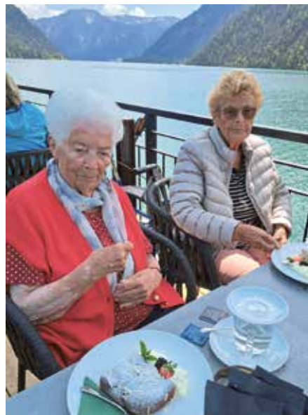
Kuchen und Kaffee auf der Terrasse beim Seerestaurant Scholastika in Achenkirch.

Die Bewohnerinnen und Bewohner des Seniorenheimes Achenkirch unternahmen kürzlich einen Ausflug zum neuen Seerestaurant Scholastika in Achenkirch, wo man zu Kaffee und Kuchen einkehrte. Da auch das Wetter mitspielte, konnten die Seniorinnen und Senioren die Sonne auf der Terrasse und den schönen Ausblick auf den Achensee und die umliegenden Berge genießen.