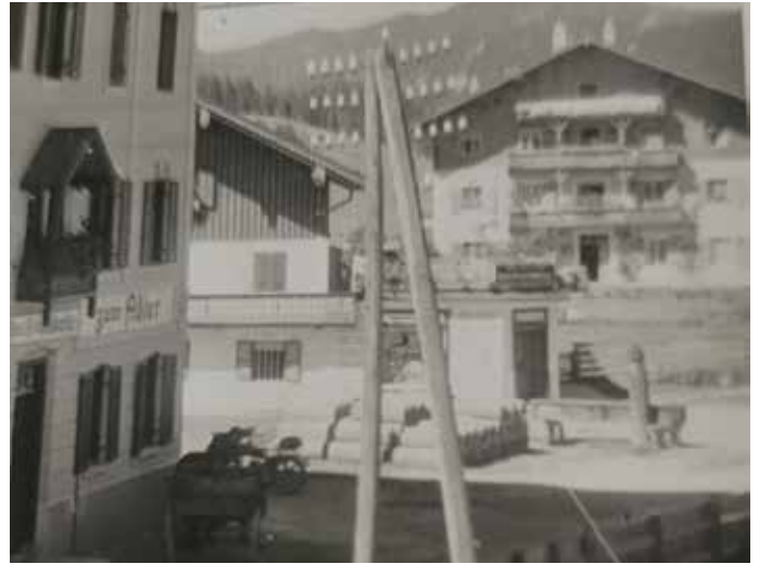
Der Gasthof Adler und das Geschäft der Familie Lechner (später Obermeir) sowie die Bäckerei Regner (heute Adler) waren die Nachbarn des alten Brunnens. Im Hintergrund ist das Schulhaus zu sehen, das im Jahre 2004 abgetragen wurde.