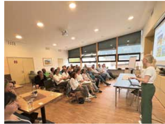
Präsentation der Ergebnisse des Pilotprojekts „Fossilfreier Weiler Neumaurach“.

Fördermöglichkeiten durch den Bund, das Land und die Gemeinde sowie auf das weitere Beratungsangebot der Energieagentur Tirol hingewiesen.