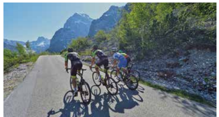
Die „Österreichische Rad-Bergmeisterschaft“ zählt zur Radbundesliga und ist die fünfte Wertung der Bundesligarennen.