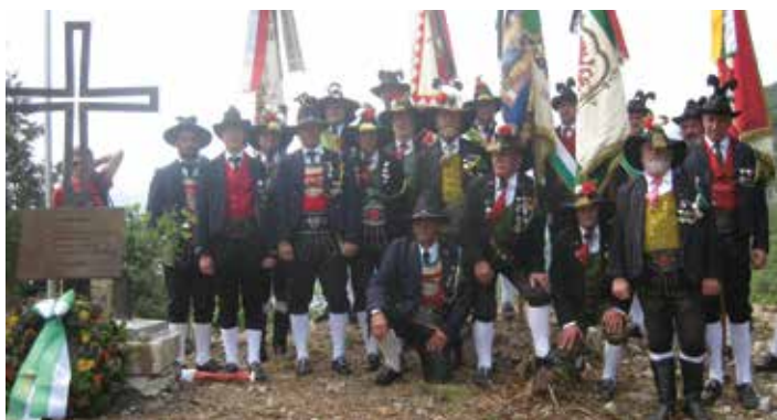
Aufstellung der Gedenkkreuze mit Feldmessen und Gedenkwanderungen.

Tirol gedenkt der Opfer des Ersten Weltkriegs vor 100 Jahren. Dabei steht das Jahr 2015 ganz im Zeichen der Erinnerung an die gefallenen Tiroler Standschützen. Der Bund der Tiroler Schützenkompanien, der Südtiroler Schützenbund und der