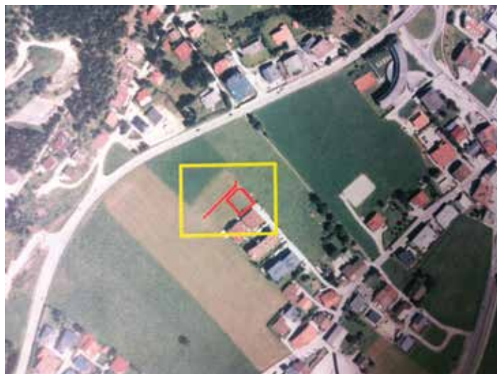
Bild oben zeigt den Planungsbereich mit der Umwidmungsfläche bei Gst. 444/13

Schon bei der Ausarbeitung des örtlichen Raumordnungskonzeptes war es ein Ziel, dass im Bereich Buchau eine größere „Freizeitanlage“ (insb. Hallen- und Freibad mit Sauna und Gastronomie) entstehen soll. Bei Ausarbeitung und Beschlussfassung des Gesamtflächenwidmungsplanes wurde jedoch nicht eindeutig klargestellt, dass neben Sportanlagen dort auch Freizeitanlagen zulässig sein sollen. Im Zuge einer „Widmungsklarstellung“ sollen auch die geplante Gastronomie und die Büros für den Tourismusverband Achensee, als Teil der Sport- und Freizeitanlage, ausdrücklich ermöglicht werden. Das geplante Vorhaben stellt für die gesamte Region eines der wichtigsten Projekte der vergangenen und künftigen Jahre dar. Mit dieser Anlage soll ein hochwertiges Freizeitangebot auch bei Schlechtwetter, sowohl für Gäste als auch für Heimische, geschaffen werden. Die Flächeninanspruchnahme bzw. Widmungsanpassung steht daher extrem im öffentlichen Interesse, wohingegen keine erkennbar nachteiligen Auswirkungen zu erwarten sind. Als Ausgleich für die verlorene Freifläche ist eine „Landgewinnung“ im Achensee geplant. Der Gemeinderat