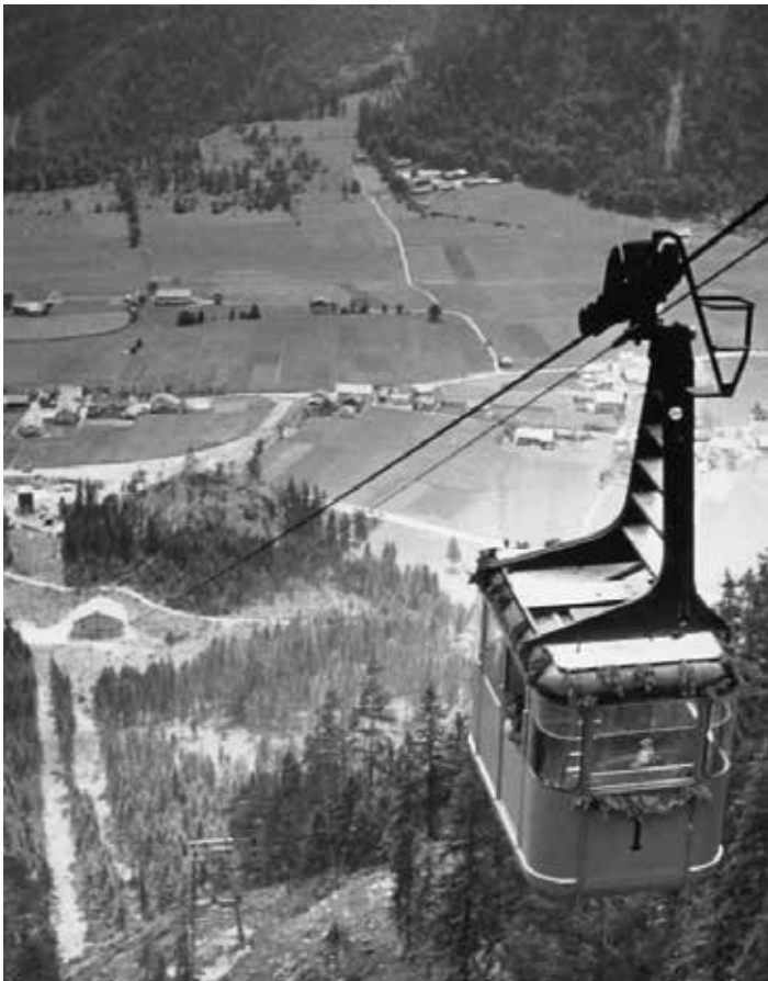
Die erste Fahrt der Rofanseilbahn am 15. Juni 1959

Zum Hoangascht-Artikel (06/2015) über die 1927 geplante Errichtung einer Seilschwebebahn sind mir jetzt noch interessante Schreiben in die Hände gekommen: Bereits einen Monat nach der Genehmigung für Vorarbeiten zur Errichtung, teilte der Deutsche und Österreichische Alpenverein mit, dass man plant Einspruch zu erheben. Daraufhin reagiert das Amt der Tiroler Landesregierung prompt: „Zur Hintanhaltung eines unnützen Kostenaufwandes wird ein Erhebungsverfahren angeordnet“. Ob das dann ausschlaggebend war, dass die Bahn damals nicht errichtet wurde ist nicht belegt. Eher dürften Schwierigkeiten in der Finanzierung durch die unsicher werdende Wirtschaftslage den Ausschlag gegeben haben.