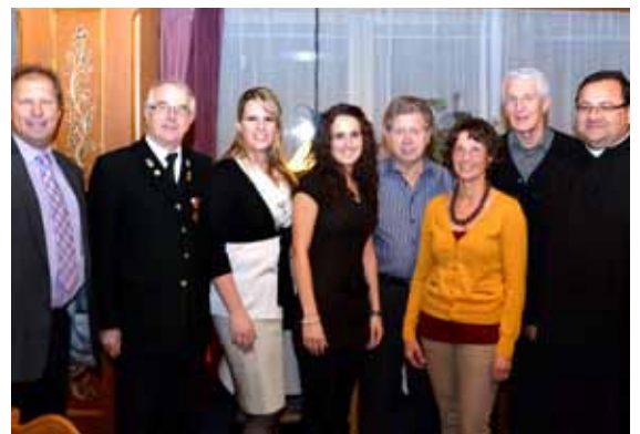
Der Kirchenchor Wiesing sucht zur Verstärkung nach wie vor sangesfreudige Frauen, vor allem aber Männer!