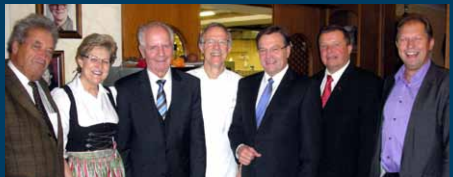
Von links: Altlandeshauptmann Wendelin Weingartner, Anni Reremoser, Altlandeshauptmann Alois Partl, Otto Reremoser, Landeshauptmann Günther Platter, Landesrat Bernhard Tilg, Bürgermeister Alois Aschberger

Vor Eröffnung der Inntaltrasse lud der Landeshauptmann zu einem „informellen“ Frühstück beim Gasthof „Dorfwirt“. Zu diesem Anlass kam viel Prominenz, wie auf dem Bild ersichtlich.