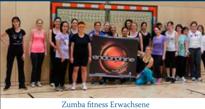
Zumba fitness Erwachsene

Unsere Kurse laufen bereits und erfreuen sich großer Beliebtheit. Es besteht jederzeit noch die Möglichkeit einzusteigen!