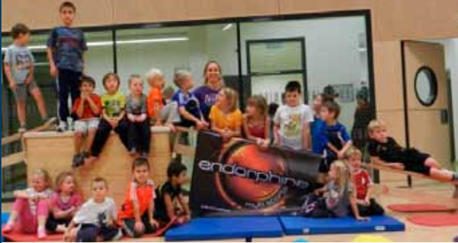
Kinder Erlebnis- / Abenteuerturnen