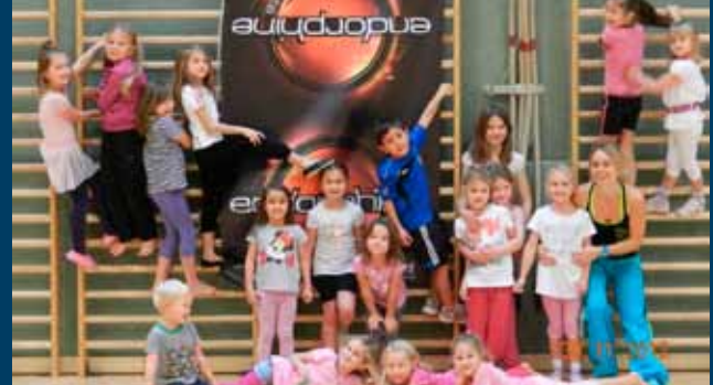
Zumba fitness Kinder