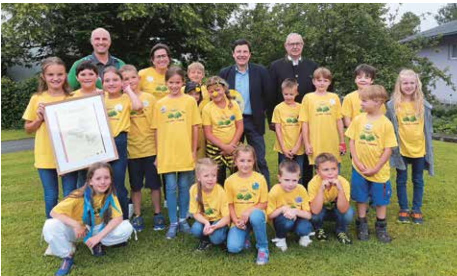
Die Volksschule Achenkirch wurde zur „Naturparkschule“ ernannt.

Ein großes Dankeschön gilt allen Beteiligten, in erster Linie den Lehrerinnen und Schülerinnen und Schülern, der Gemeinde Achenkirch, den Ortsbäuerinnen von Achenkirch sowie dem Land Tirol für die finanzielle Unterstützung. Weitere Infos zu den Naturparkschulen gibt es auf der Website www.karwendel.org im Bereich „Schule & Bildung“ sowie auf www.naturparke.at zum Projekt „Österreichische Naturparkschulen und - kindergärten“.