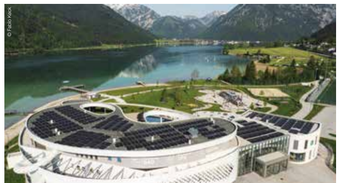
Neue Photovoltaikanlage auf dem Dach des Atoll Achensee.

Mit seinem nachhaltigen Energie- und Betriebskonzept erfüllt das Atoll Achensee höchste ökologische Standards. Im April 2023 wurde auf dem Dach eine neue Photovoltaikanlage installiert. 480 Hochleistungs-Solarpaneele erzeugen mit 196,8 kWp installierter Leistung rund 220.000 kWh. Das entspricht in etwa dem jährlichen Stromverbrauch von 40-50 Haushalten. Somit produziert das Atoll Achensee seinen eigenen Ökostrom für umweltfreundliches Bade- und Saunavergnügen.