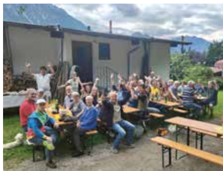
Nachbarschaftsfest Oberer Rofangarten.