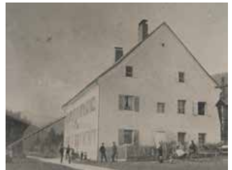
Das alte Zollamt mit Schranken ca. 1900.