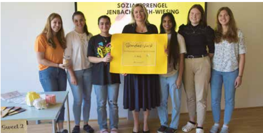
Die HBLFA Tirol stellte nachhaltige Bienenwachstücher her.