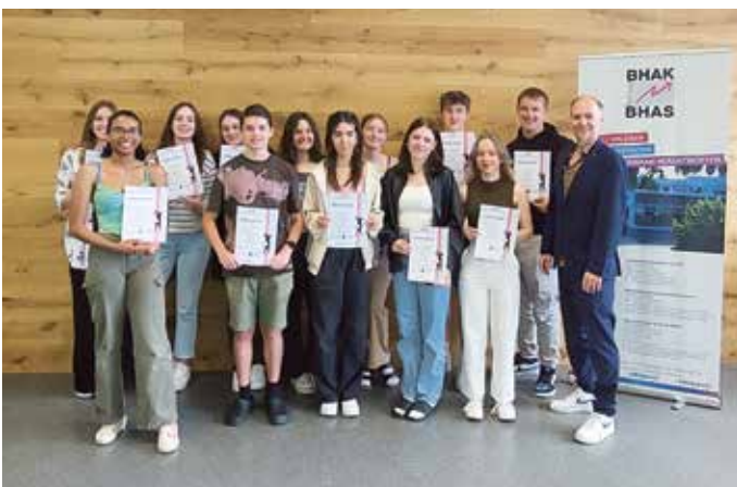
Die dritte Klasse der BHAK Schwaz nahm an einem „Benimm-Workshop“ teil.

Als Abschluss erhielten alle Teilnehmer des Workshops das „Gesellschaftszertifikat für Lebenskultur“, welches von der Wirtschaftskammer Österreich unterstützt wird. Dieses Zertifikat dient als wertvolle Referenz für Bewerbungen und zeigt künftigen Arbeitgebern, dass die Absolventen über notwendige soziale Kompetenzen verfügen. Die BHAK Schwaz bedankt sich sehr herzlich beim Gasthof Fischerwirt Achensee für die Organisation und Durchführung des Businessessens. Ein großer Dank gilt weiters dem Unternehmen Wimpissinger Beton Umweltschutz GmbH & Co KG für die Finanzierung des Workshops.