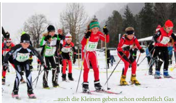
...auch die Kleinen geben schon ordentlich Gas