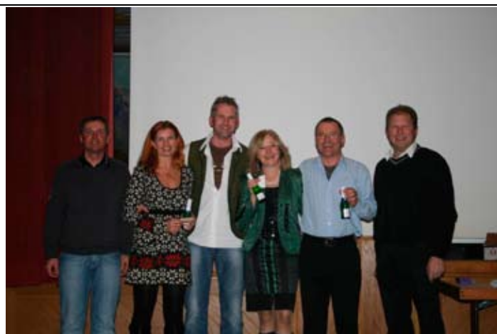
Fam. Pfattner und Fam. Motz