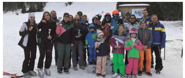
Der Franz-Lentsch-Gedächtnislauf (hier 2020) musste 2021 leider abgesagt werden.