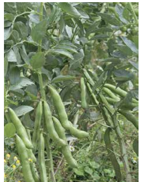
Achentaler Boan, Ackerbohnen