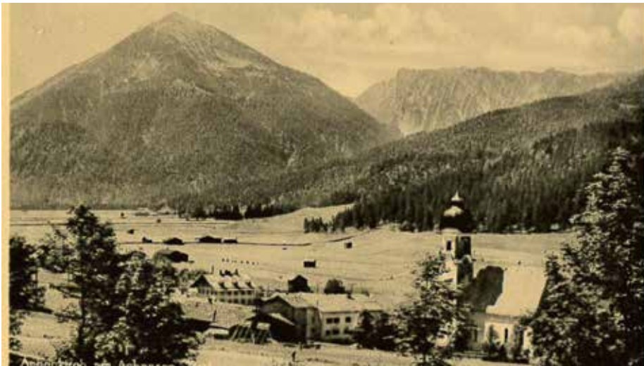
Alte Ansichtskarte von Achenkirch.