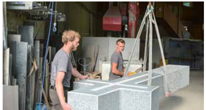
Abtransport des Gipfelkreuzes auf die Seekarlspitze.