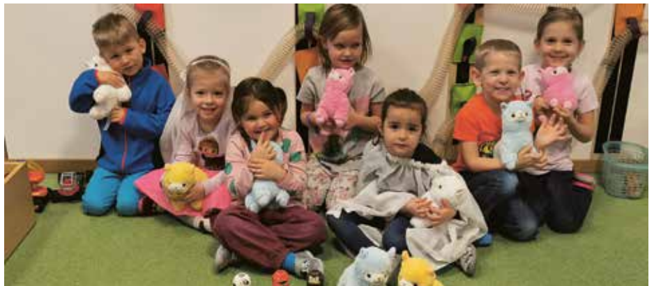
Die Kindergartenkinder durften sich über Plüschlamas und Tiertaschenlampen freuen.

Die Sparkasse Schwaz überraschte den Kindergarten kürzlich mit tierischen Geschenken, die eigentlich für den Weltpartag im vergangenen Oktober gedacht waren. So durften sich die „Kindergartler“ über Plüschlamas und Tiertaschenlampen freuen. Die Begeisterung war riesengroß. Ein herzliches Dankeschön an die Sparkasse Schwaz.