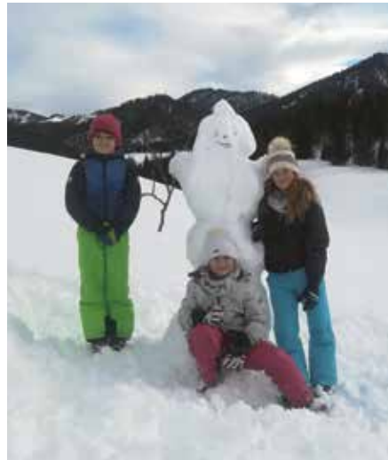
Turnunterricht einmal anders: Die Volksschulkinder beim Schneemannbauen.

die Schule zu bringen, um leichten Gewissens ihrer Arbeit nachzugehen. Die Kinder arbeiteten sehr selbstständig und fleißig. Da wir schon immer großen Wert auf Eigenständigkeit gelegt haben, hat das auch sehr gut funktioniert. Selbst die Turnstunden ließen sich mit Abstand und unter Einhaltung der Hygienevorschriften nett gestalten.“