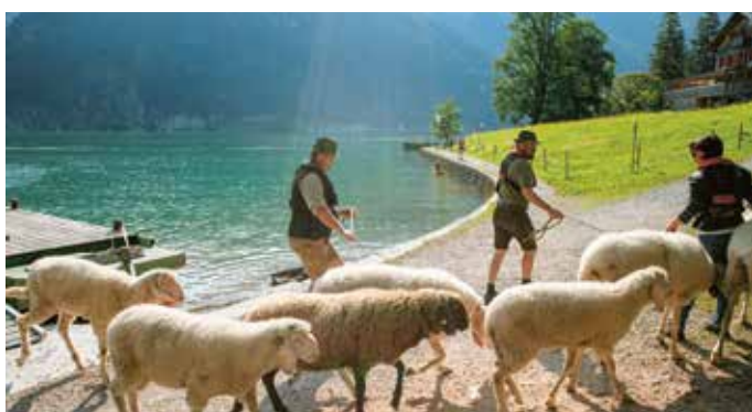
Almauftrieb der Schafe mit dem Floß.