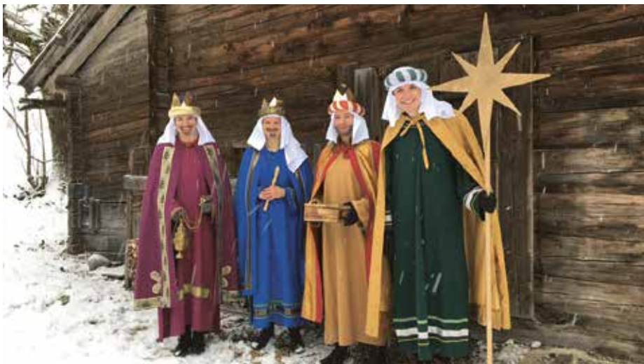
Die Ebener Sternsinger beim Aufnehmen ihrer Videobotschaft.

für Kinder in der Dritten Welt, die die Corona-Krise besonders hart getroffen hat. Auf diesem Weg kam eine stolze Summe von EUR 6.200,00 zusammen. Vielen lieben Dank an alle, die gespendet haben, für eure Unterstützung.