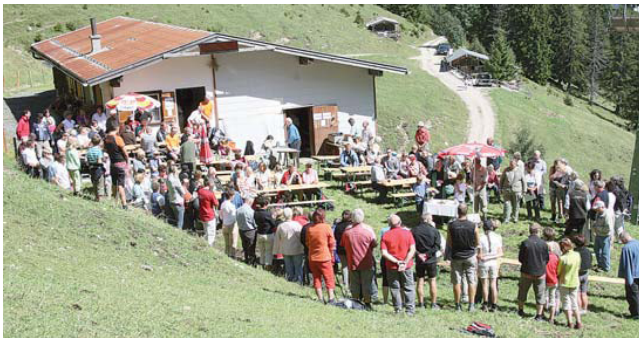
Almmesse auf der Gföllalm (Lenterer Hütte)