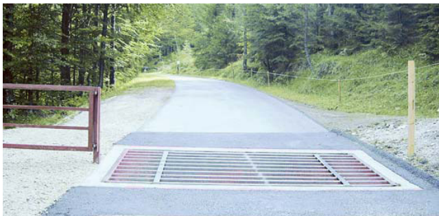
Einbau Weiderost Enter-Durra-Straße