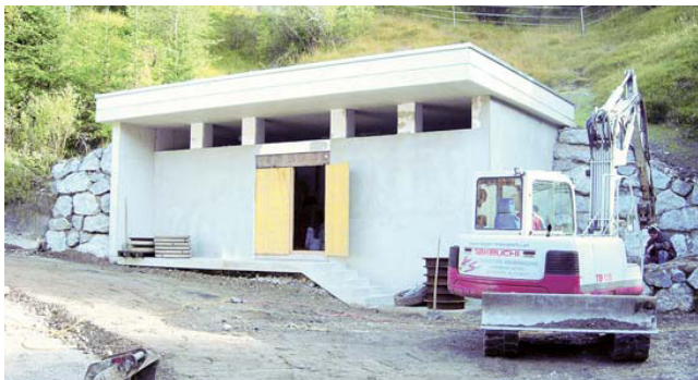
Errichtung Pumpwerk „Gemeindegasse“