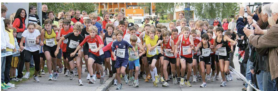
Start vom Achensee Sprint/Kinderwertung am Samstag, 5. September.