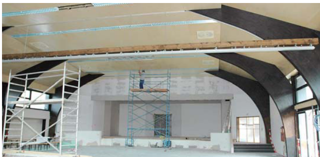
Veranstaltungssaal mit Turnsaal auf gleicher Ebene, mit der neuen Akustikdecke.