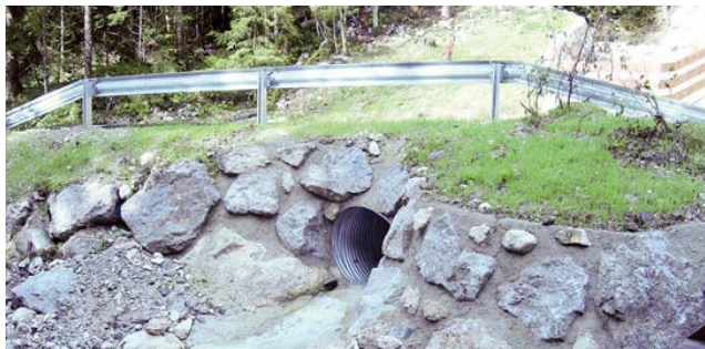
Erneuerung Durchlass Moosbach