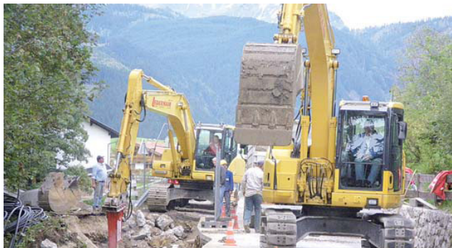
Ableitungskanal nach Achenkirch – Kanalausmündungsarbeiten im Ortsteil Leiten Achenkirch