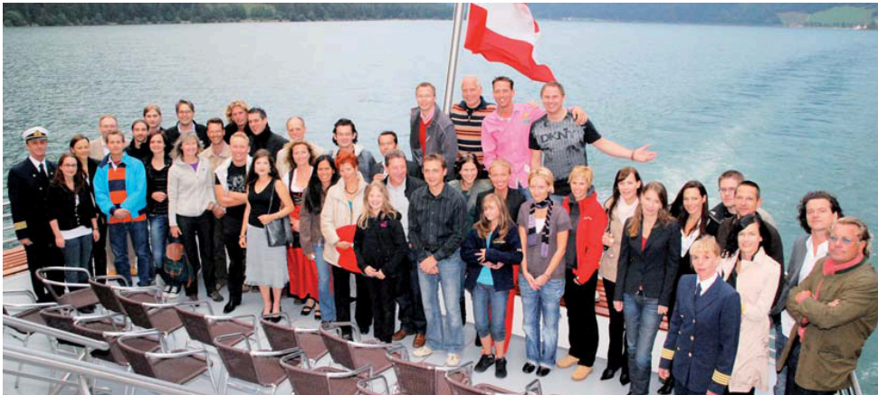
Das Familienfoto des dritten Gipfeltreffens der Wetterfrösche mitten auf dem Achensee.

Am zweiten September-Wochenende tummelten sich über 20 Wettermoderatoren in Seefeld und am Achensee. Beim bereits traditionellen Gipfeltreffen der Wetterfrösche - einem besonderen Branchentreff für Wettermo-