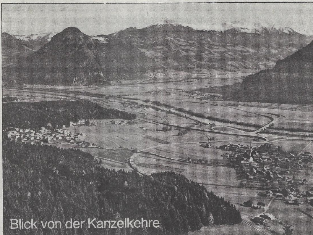
Blick von der Kanzelkehre