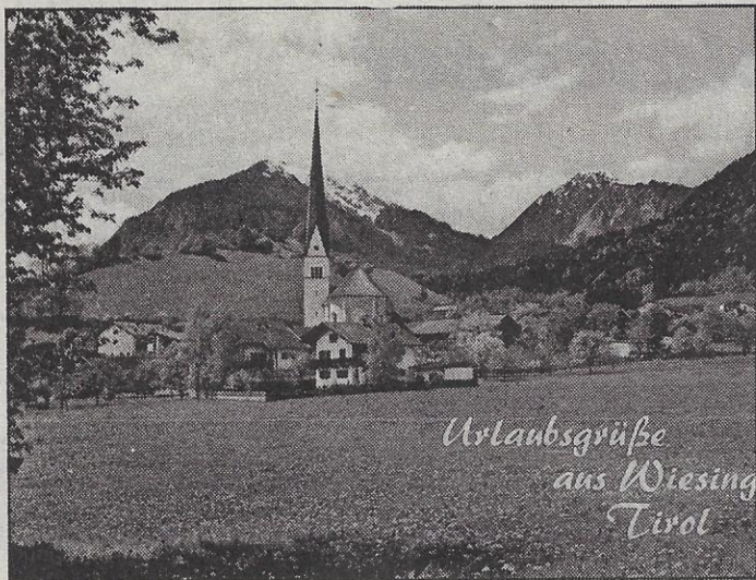
Urlaubsgrüße aus Wiesing Tirol