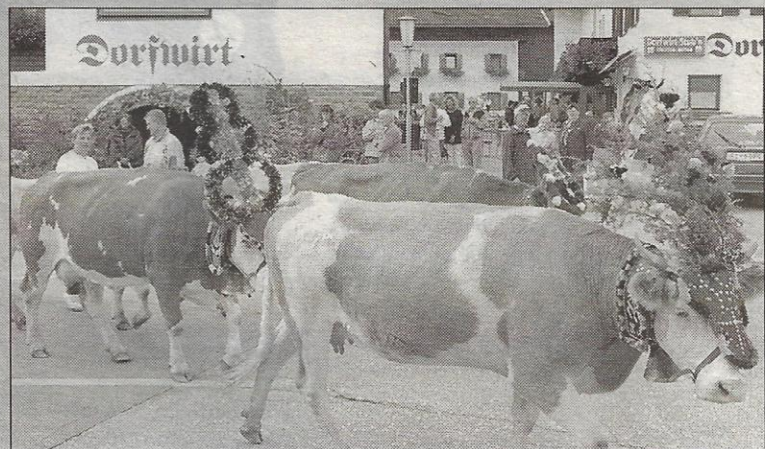
Almabtrieb in Wiesing, vor dem »Dorfwirt«.

In Wiesing waren am 20. September vom Melchermuas bis hin zu Knödeln und Krapfen die besten Schmankerln zu bekommen. Ein ganz besonderer Anziehungspunkt war wieder die Schnapsbrennerei mit Verkostung. Am Nachmittag zog das geschmückte Almvieh in die heimatlichen Ställe.