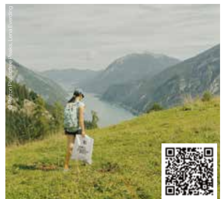
Mitmachen, gewinnen und zum Umweltschutz beitragen - „Tirol CleanUP Days“.

Ladet ein Foto eurer Aufräumarbeiten auf die „CleanUP-Galerie“ hoch, damit nehmt ihr automatisch an einem Gewinnspiel teil. Weitere Infos unter www.achensee.com .