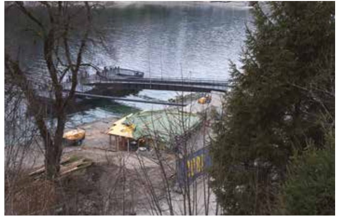
Den Baufortschritt kann man unter www.achenseeschiffahrt.at mitverfolgen.