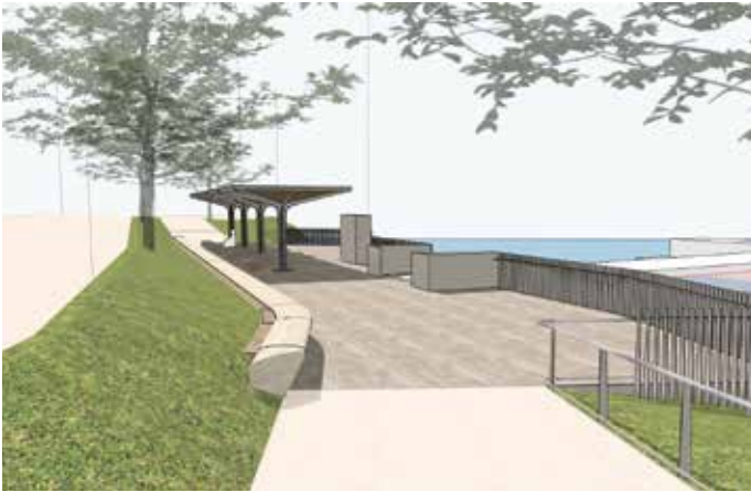
Visualisierung der neuen Anlegestelle „Scholastika“.

Wo einst ein Grandhotel stand, führt die Achenseeschiffahrt eine grandiose Erneuerung der Anlegestelle Scholastika durch. Dieser Sanierungsschritt ist ein Meilenstein in der regionalen Entwicklung, ganz besonders auch für Achenkirch. Diesen Sommer schon können Besucherinnen und Besucher unkompliziert und barrierefrei über die neue Steganlage in die Schiffe der Achenseeschiffahrt ein- und aussteigen. Die Wartezeit wird zum genüsslichen Verweilen am See, mit ausreichend Sitzplätzen sowie wettergeschützt unter modernen Schirmen. Die Vorfreude ist groß! Wer sich für den Fortschritt auf der Baustelle interessiert, kann diesen über die Webcam auf www.achenseeschiffahrt.at miterleben.