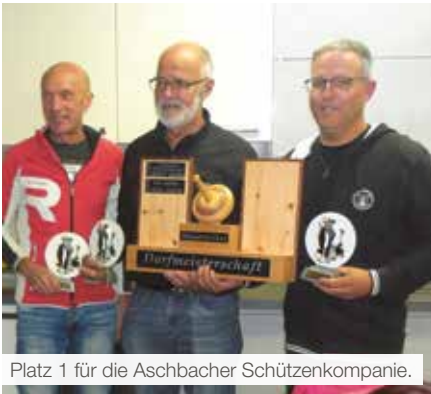
Platz 1 für die Aschbacher Schützenkompanie.