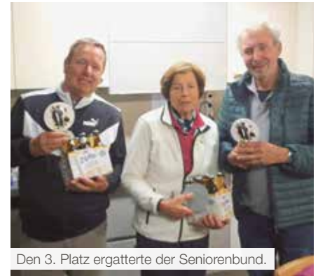
Den 3. Platz ergatterte der Seniorenbund.