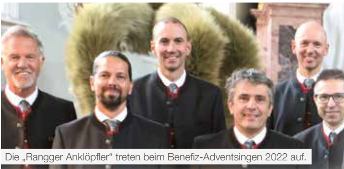
Die „Rangger Anklöpfler“ treten beim Benefiz-Adventsingen 2022 auf.

Das Achensee'r Benefiz-Adventsingen findet am Samstag, den 26. November 2022, um 17.00 Uhr in der Mehrzweckhalle Achenkirch statt. Eintritt: EUR 15,00. Informationen und Kartenreservierungen nehmen wir gerne unter der Telefonnummer 0664/5127475 oder per Mail ( michael@pattis.org ) entgegen.