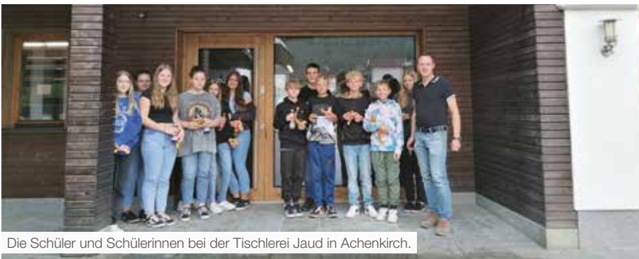
Die Schüler und Schülerinnen bei der Tischlerei Jaud in Achenkirch.