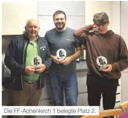
Die FF-Achenkirch 1 belegte Platz 2.