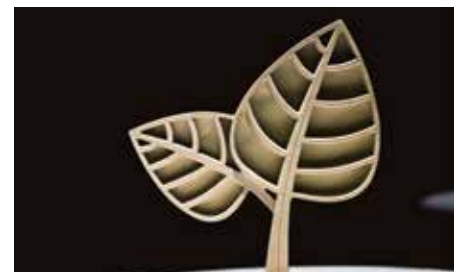
Das Atoll Achensee ist für den „3. Tirol Change Award“ nominiert.

bis Freitag, dem 18. November 2022 eure Stimme für das Atoll Achensee abgibt. Der Gewinner des „Tirol Change Awards 2022“ wird mittels Online-Voting sowie durch die Bewertung einer Fachjury ermittelt. Der „Change Summit“ und die Verleihung des „Tirol Change Awards“ können am Dienstag, dem 22. November 2022 (ab 18.00 Uhr) unter folgendem Link www.lebensraum.tirol/livestream live mitverfolgt werden.