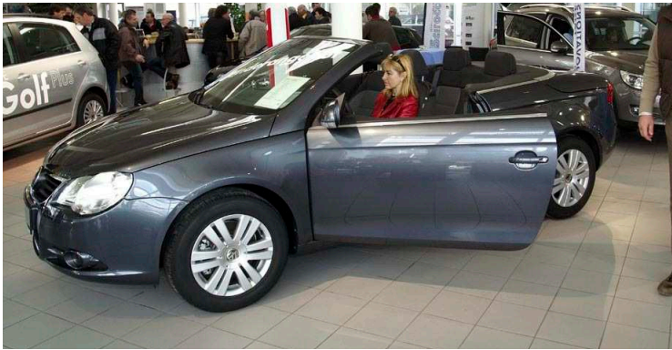
(1.) Im Rampenlicht standen bei der Frühjahrsautoschau am vergangenen Wochenende neben dem Golf Plus auch die Cabrios, für eine Probefahrt war es zu kalt.