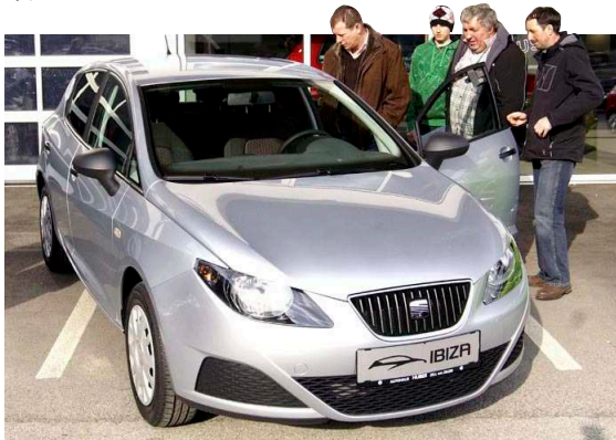
(3.) Von der großen Modellauswahl überzeugten sich viele bei der Frühjahrsautoschau in Zell am Ziller.