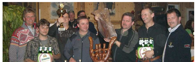
(8.) Zehn Musikkapellen waren am Start. Schnellste in der Mannschaftswertung war die BMK Tux vor der BMK Finkenberg und BMK Hippach.