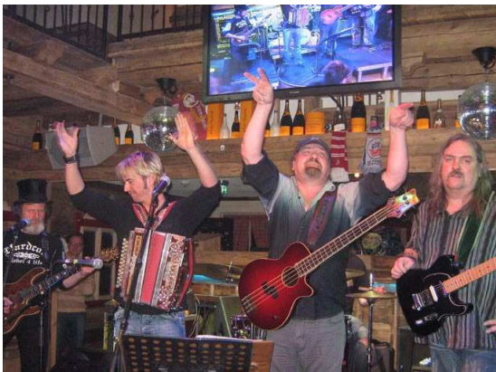
(5.) Sensationelles Foto aus der „Kleinen Tenne“ in Lanersbach/Tux! Florian Silbereisen mit den Trucks.