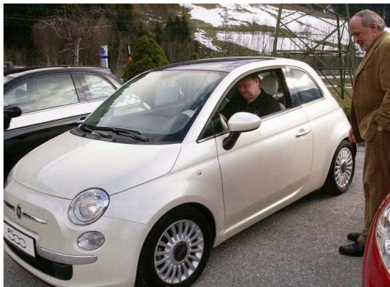
(4.) Der legendäre Fiat 500 war ein Kundenmagnet bei der Frühjahrsausstellung im Autohaus W. Haidacher.