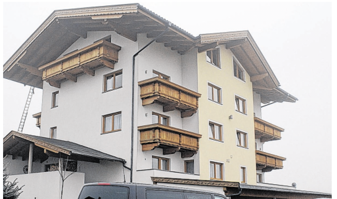
Aus der gewidmeten Hofstelle ist ein Appartementhaus mit Schwimmbad geworden. Gegen den Abbruchbescheid, der höchstgerichtlich bestätigt worden ist, wehrt sich der Hausherr mit seinem Anwalt weiterhin.

„Solche Drohungen kennen wir schon lange. Aber alles ist rechtlich durch das Vollstreckungsgesetz gedeckt. Und an das halten wir uns genau“, antwortet der Schwazer Bezirkshauptmann Karl Mark. Schäfer glaubt, dass der Abbruch technisch nicht möglich ist. Betroffen wäre u. a. das Obergeschoß und das Hallenbad. „Es dürfen weder Leitungen noch Decken und Böden und auch nicht der Lift beschädigt werden“, meint Schäfer und