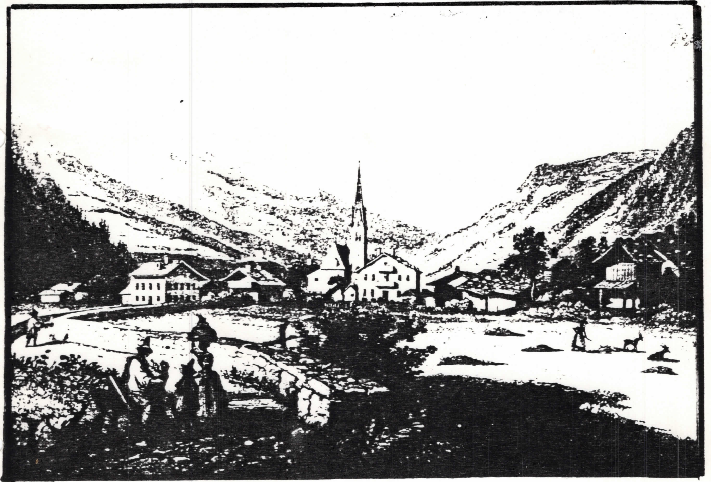
Angaben zur Zillertaler Heimatkunde