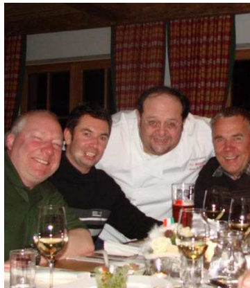
(2.) Superstimmung gab es auf der Platzlalm.