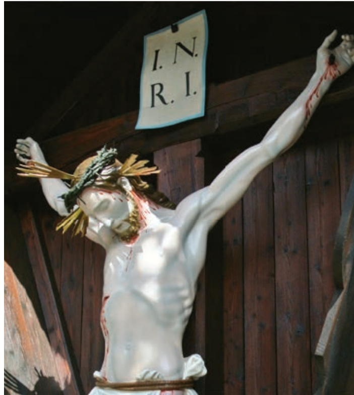
„Es liegt etwas Edles, Hohheitsvolles und Mildes im Antlitz, das den Beschauer tief ergreift“. (Ibk Nr. 1904)