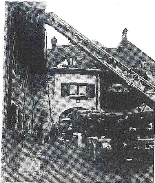
(Brand Schulgasse, 20.02.)