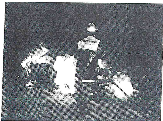
(Autobrand am 17.12.)