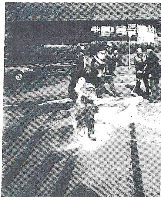
(Ölaustritt LKW, 04.01.)

20.04. Fehllalarm, LKW Brand auf der Autobahn.