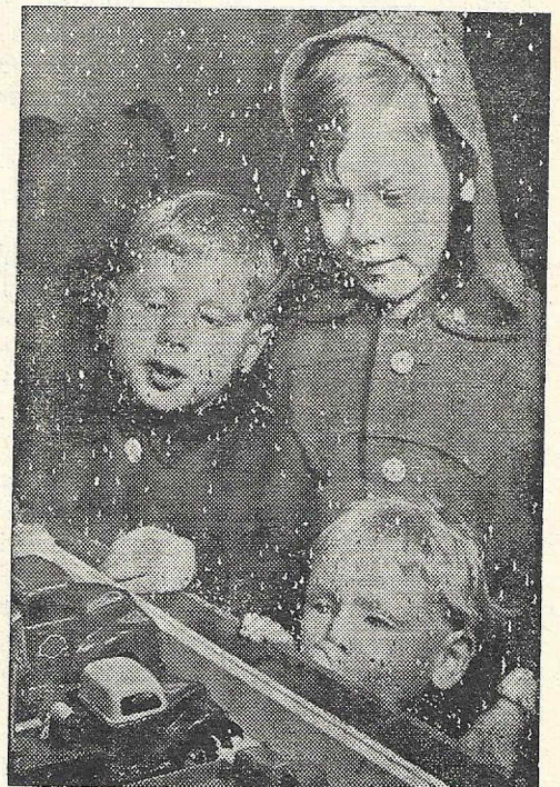
KINDER — vor der Auslage

Es ist nicht so, daß dieses Projekt nur in den Köpfen weniger Idealisten existierte. Im Gegenteil, man ist im ganzen Paznauntal - und hier vor allem von Ischgl bis See - von der Rentabilität der Bahn voll überzeugt. Man