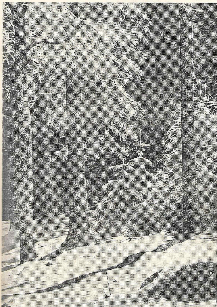
Der Wunschtraum aller Schisportler:

Am 10. Jänner 1965 veranstaltete der Eisenbahnsportverein Oberinntal, wie in den vergangenen Jahren, sein traditionelles Grenzlandschießen auf dem romantischen Weiher vor dem Tramser Hof oberhalb Landeck. Achtzehn Moarschaften aus Tarasp und Davos in der benachbarten Schweiz, aus Meran, Garmisch, Bludenz, Hall, Telfs und Landeck trugen auf sieben Bahnen ihre sportlichen Kämpfe aus, die durch die