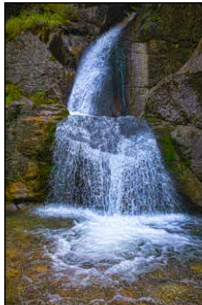
Wasserfall Vilser Alm