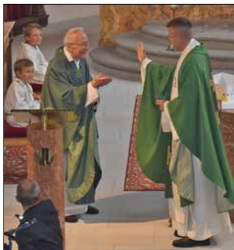
Verabschiedungsgottesdienst in Pinswang