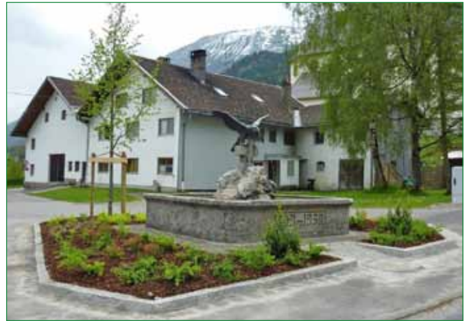
Schon jetzt - mit noch frischer Bepflanzung - erweist sich der Platz im Untertor als kleines Schmuckstück der Stadt.