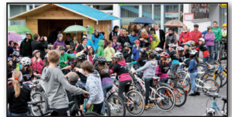
Der Umweltausschuss der Stadtgemeinde Vils

„Der kleine November möge bitte nicht auch noch den Juni belästigen!“