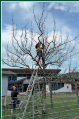
Mitglieder schneiden die Obstbäume bei der Schule und dem KIGA.

Besuchen Sie uns auf facebook.com/sparkassereutte