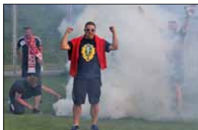
Die Fans sorgten auswärts wie zuhause für Stimmung - unteres Bild: „Fanparkplatz“ beim letzten Heimspiel