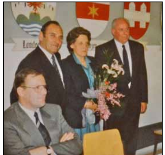
30-jähriges Dienstjubiläum und zugleich letzter Auftritt als Bürgermeister der Stadt Vils (04.04.1959 - 07.04.1989)