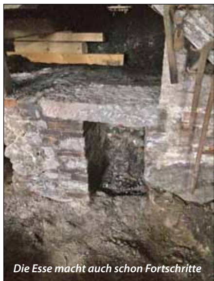
Die Esse macht auch schon Fortschritte