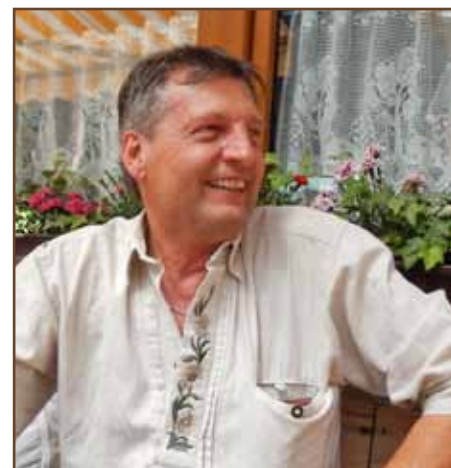
Mit einem zuversichtlichen Blick in die Zukunft ...