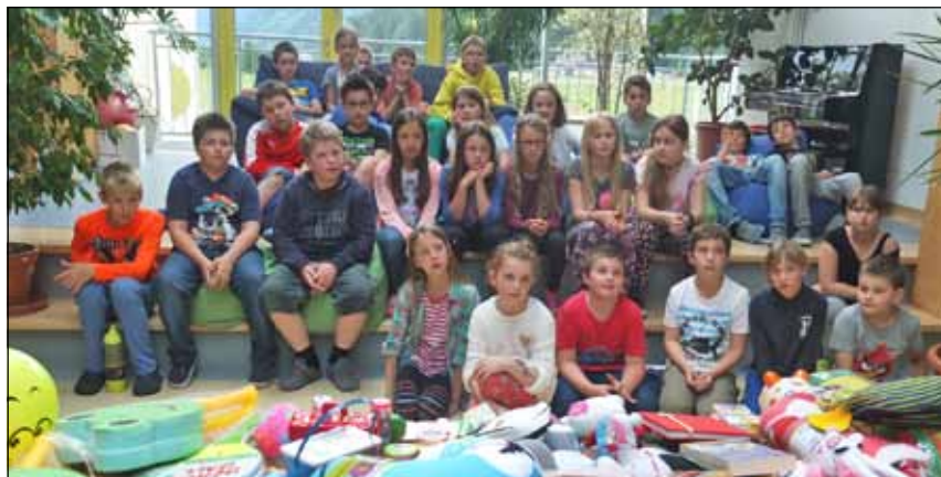
(Texte/Fotos VS Vils)