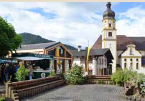
Andrang bei der Brauereibesichtigung - und alle Hände voll zu tun hatten Conny und Pius Kieltrunk