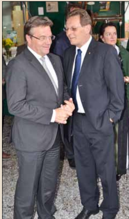
Ziemlich beste Freunde: LH Günther Platter und Bgm. Günter Keller