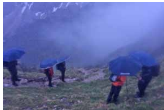
„Regenschirmkunst“ am Kegl

Auch am Sonntag begleiteten uns Starkregen und Nebel, aber um ca 21:30 Uhr war die Sicht klarer und auch in den Vilser Bergen konnten die Bergfeuer zur Erinnerung an dieses Herz-Jesu-Gelöbnis in kleinerer Form entzündet werden.