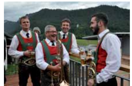
Entspannung auf der Saal-Terrasse

Ab sofort könnt Ihr unseren Saal für Eure Veranstaltungen nutzen. Mit seinen 80 Sitzplätzen und der großzügigen Terrasse bietet er Euch die passende Räumlichkeit für Geburtstage, Hochzeiten und andere Familienfeiern. Er ist ebenso geeignet für Firmenveranstaltungen, Jubiläen, Seminare, usw. Der freie Blick auf phantastische Sonnenuntergänge, dem herrlichen Panorama mit den Burgen Vilsegg und Falkenstein, verleihen jeder Veranstaltung eine unvergessliche Atmosphäre.