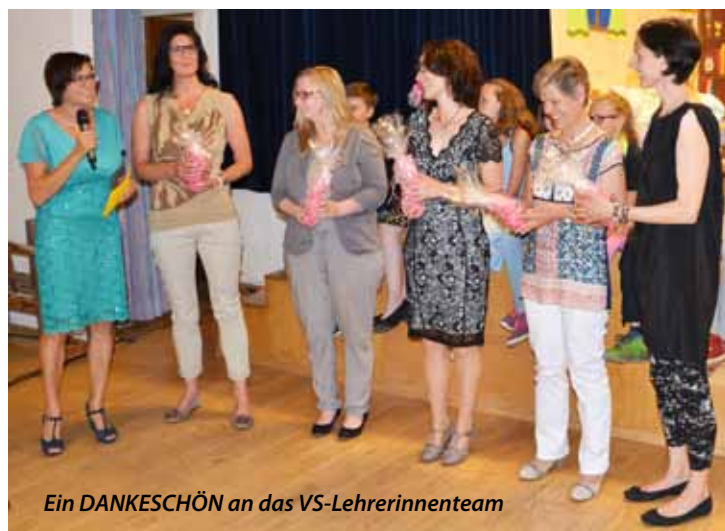
Ein DANKESCHÖN an das VS-Lehrerinnenteam