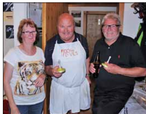
Was wäre eine Veranstaltung ohne sie - die „Verpflegungs-Crew“