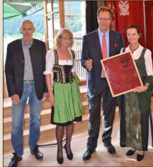
Schlüsselübergabe durch Architektenteam