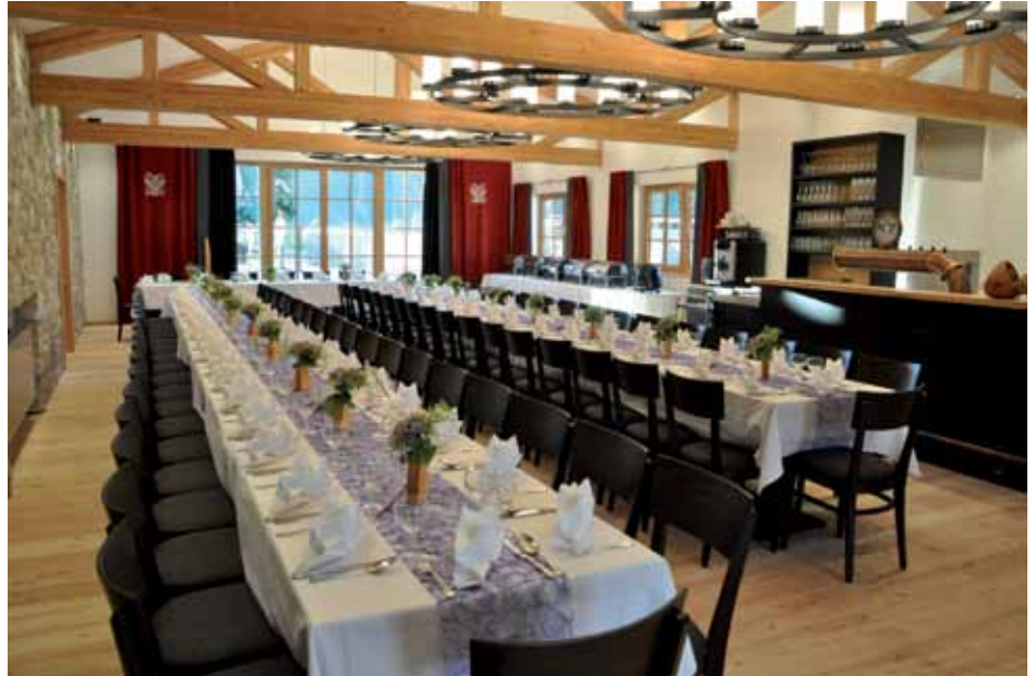
Der neue Maura-Saal mit festlich eingedeckter Hochzeitstafel.