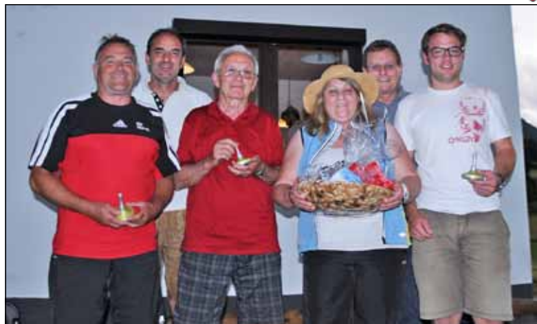
Die Stadtchefs mit ihrer Siegermannschaft