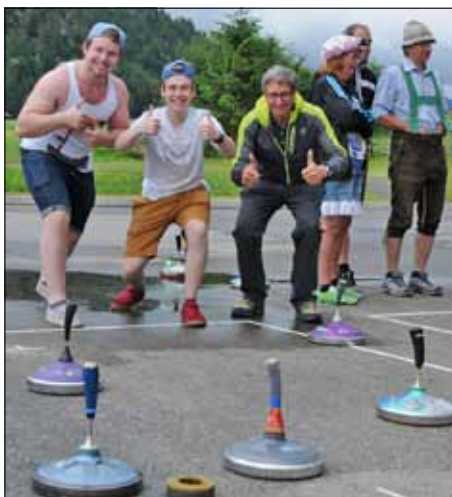
Die Schretter & Cie Mannschaft mit ihrem Chef in Topform