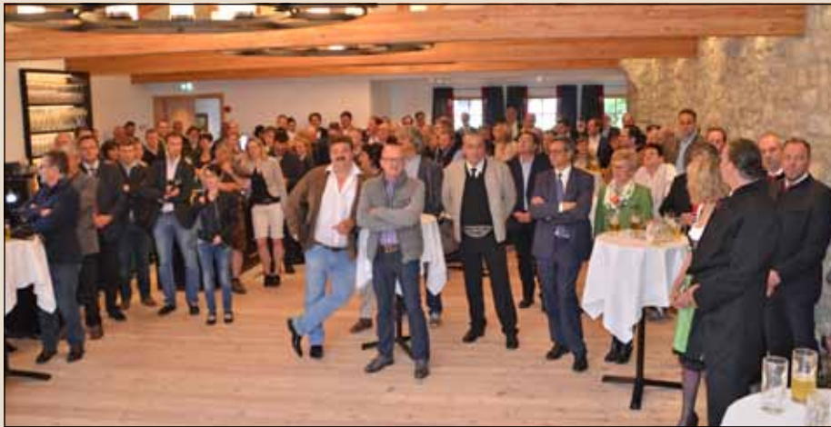
Ein wahres Schmuckstück: Der neue Saal in der Maura mit Dachterrasse