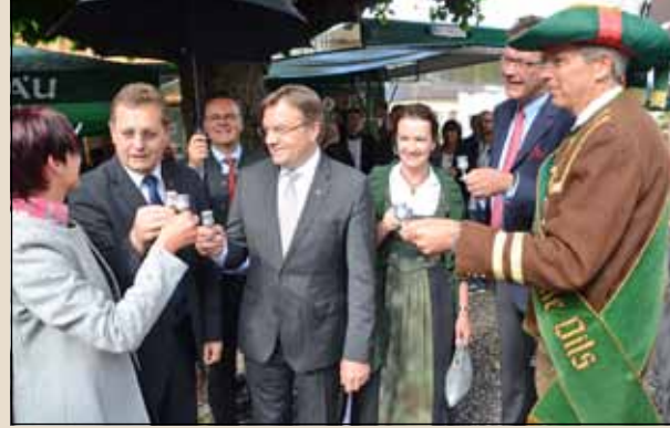
„Landesübliche“ Begrüßung durch die Stadtkapelle Vils