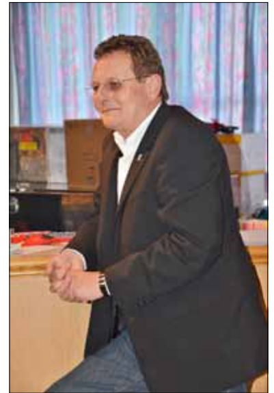
Auch der Stadtchef hat sich amüsiert