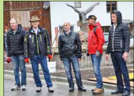
OGV Ausschussmitglieder bei der Baumpflanzung