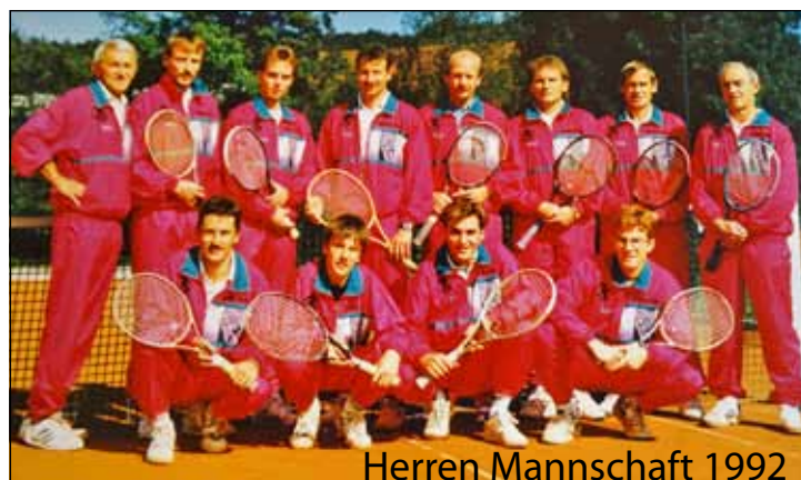
Herren Mannschaft 1992