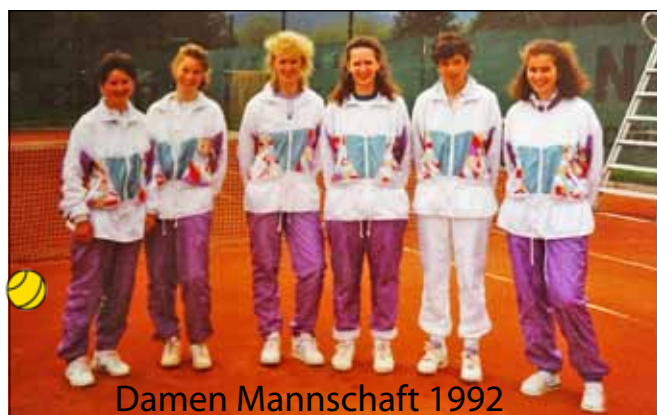
Damen Mannschaft 1992