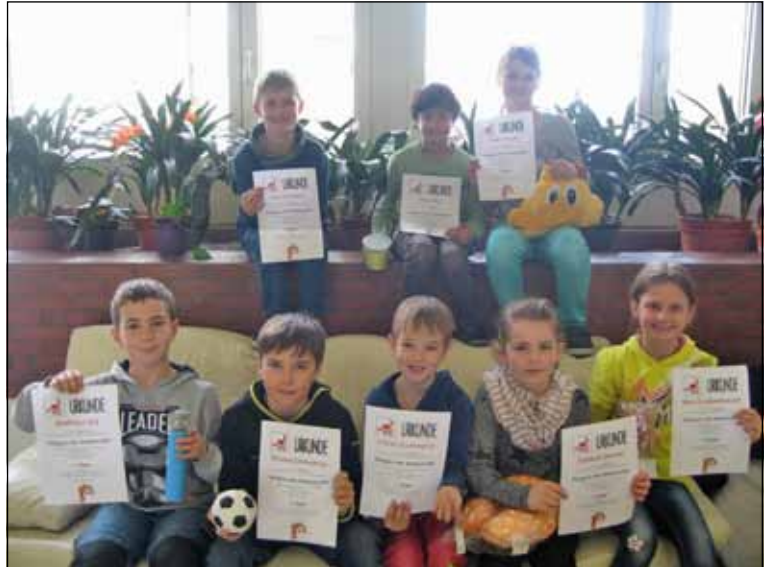
(T/F: VS Vils)

Das Lehrerteam der VS gratuliert allen Siegern ganz herzlich. (nicht im Bild: Klara Schwarz)