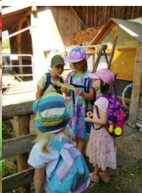
Schatzsuche in St. Anna!