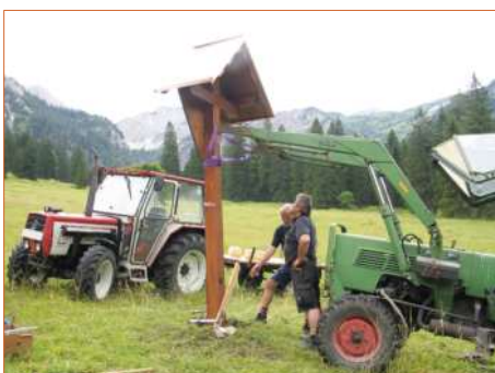
Aufstellung am Vorderen Alphof