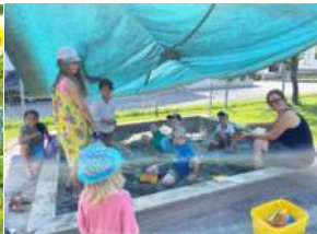
Wir haben Sandburgen gebaut, es wurde Gold geschürft und zwischendurch haben wir uns mit Wasserluftballons abgekühlt!