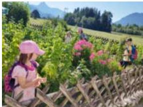
Sissi hat uns eingeladen in St. Anna Beeren zu pflücken!