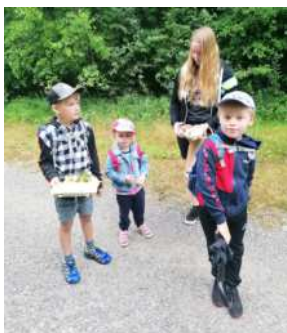
Naturbingo, wir haben unterschiedliche Naturmaterialien gesucht! Jene, die am schnellsten alle vorgegebenen Materialien gefunden haben, haben Bingo gerufen! Dadurch wurden Achtsamkeit, Wahrnehmung und Reaktionsvermögen trainiert!