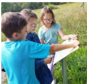
Wir suchten passend zu unseren Geburtsdaten die Bäume und stellten fest, dass so einiges von den Beschreibungen auf uns zutrifft!