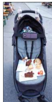
Das nennt man „Speisewagen“