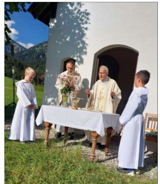
Messe bei der Kapelle in der Angerwies

Zum Hohen Frauentag haben die Blumenfrauen unter der Leitung von Ingrid Beirer fleißig Kräuter und Blumen gesammelt und zu ca. 80 schönen Sträußen gebunden. Beim Festgottesdienst wurden diese dann geweiht. Die Blumenfrauen freuen sich, dass nach der Messe und nach der Prozession alle Sträuße mitgenommen wurden. Sie bedanken sich für die freiwilligen Spenden für die Blumenkasse!