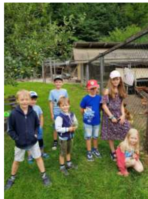
Hühner füttern und Pony streicheln in St. Anna!