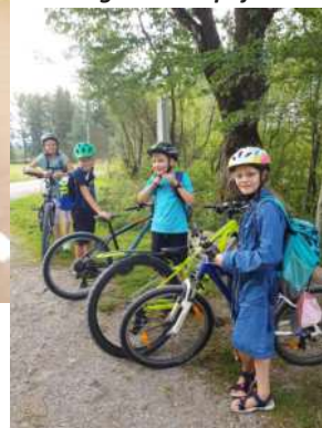
Unser Radausflug zum Keltischen Baumkreis!