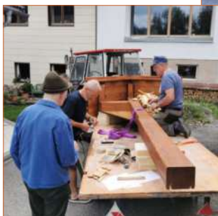
Anfertigung des Kreuzes und anbringen des Corpus