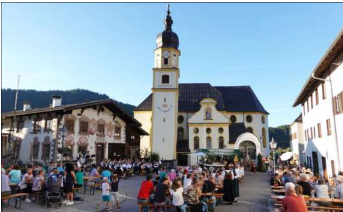
Bei herrlichem Wetter wurden mit dem Pfarrfest die Platzkonzerte „eingeläutet“.