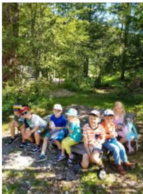
Wir sind sehr gerne auf dem tollen Spielplatz.