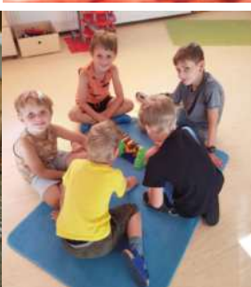
Das Biberspiel und Looping Louie waren diesen Sommer sehr beliebt bei den Kindern!