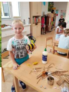
Aus leeren Dosen und Bambusstäben bastelten wir Insektenhotels!