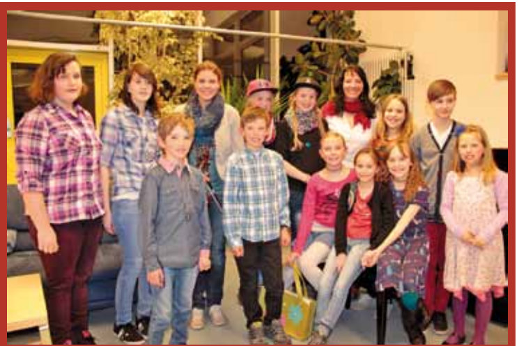
Eine stolze Klavierlehrerin mit ihren fleißigen SchülerInnen beim Vorspielabend am 14. März in der Bücherei.