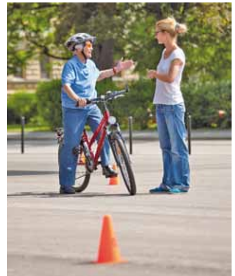
Mit dem Fahrrad gesund, kostengünstig und klimafreundlich unterwegs.

Die Fahrradkurse sind ein wichtiger Beitrag zur Förderung des umweltfreundlichen Radverkehrs, für mehr Unabhängigkeit in der Nahmobilität, zur Stärkung des sozialen Zusammenhalts in der Gemeinde und zur Gesundheitsförderung im Seniorenalter. Der E-Bike-Kurs für SeniorInnen wird im Rahmen des Projekts „Mobilität ohne Barrieren“ vom Klimabündnis Ti-