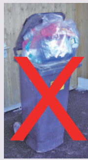
Ausschuss für Umwelt und Abfallwirtschaft

Wir weisen darauf hin, dass eine nichtgeschlossene Tonne von der Müllabfuhr NICHT mitgenommen wird. Laut Müllabfuhrordnung vom 1.1. 2009 § 4 Absatz 5 dürfen Restmüllbehälter nur soweit befüllt werden, dass sie ordentlich geschlossen werden können. Außerdem darf der Müll in den Müllbehältern nur soweit verdichtet werden, dass er ohne Schwierigkeiten entleert werden kann.