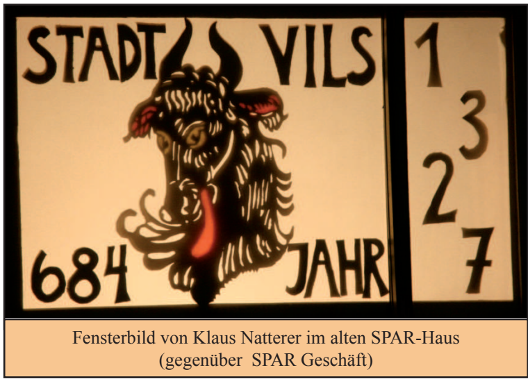
Fensterbild von Klaus Natterer im alten SPAR-Haus (gegenüber SPAR Geschäft)