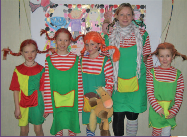
Die Lehrer und Schüler der Volksschule bedanken sich bei den Elternvertreterinnen für das tolle Buffet beim Schulfasching am Faschingsdienstag!