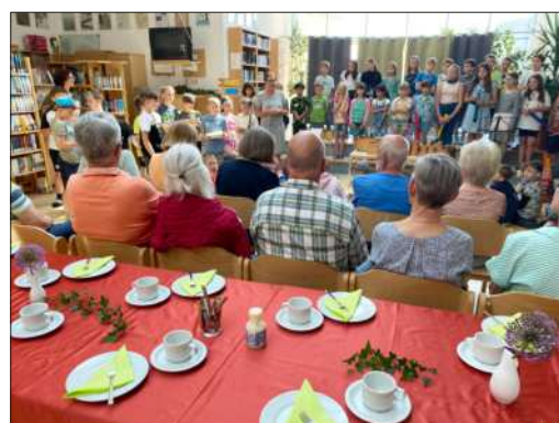
Die Schülerinnen und Schüler bedankten sich mit fröhlichen Aufführungen.