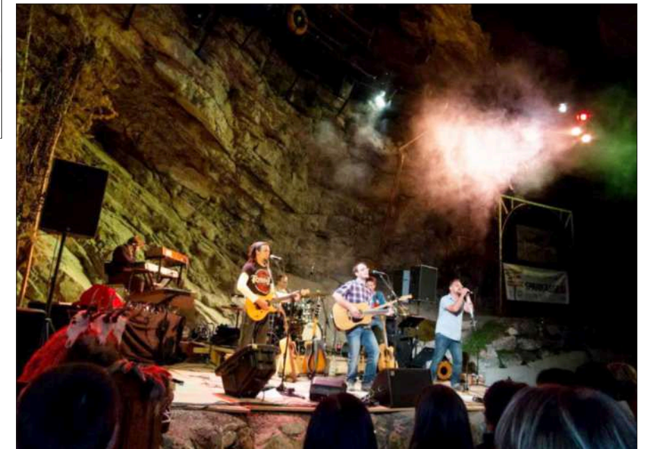
Bandmitglied bei „2er Beziehung“