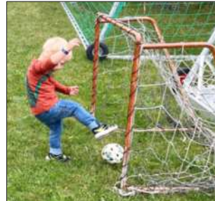
...gang endlich eiã...