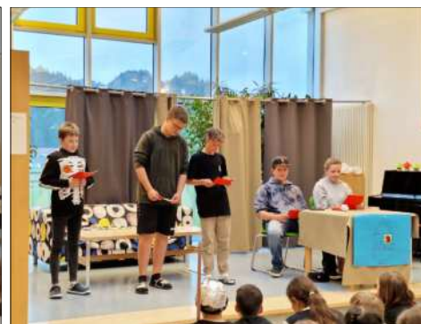
Gruppe 3 präsentierte aktuelle "News in English".