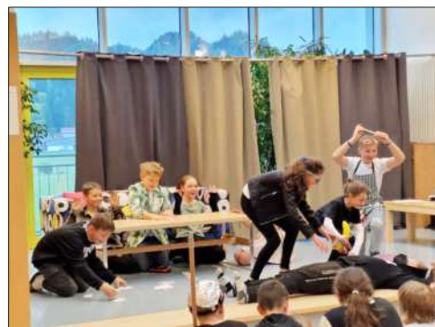
Ein Überfall auf eine Essensgesellschaft wurde von Gruppe 2 gerade noch verhindert.