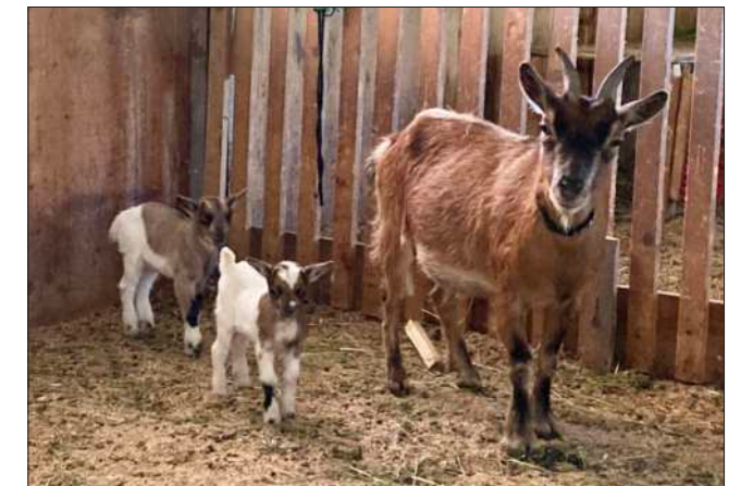
Zwei süße, kleine Zwergziegen haben im Stall von „Bill“ das Licht der Welt erblickt und halten ihre Mama auf Trab.