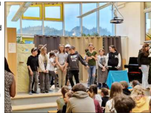
Die Gruppe 1 führte den Sketch "Der Wolf und die sieben Geißlein" auf Englisch auf

Insgesamt 59 Vilsener Schüler, fast die gesamte Mittelschule, nutzten die einmalige Chance, ihre Englischkenntnisse zu vertiefen und vor allem ihre Sprachfertigkeiten zu verbessern. Die Kursgebühr war gut angelegt, denn jedes Kind hat auf seine Weise profitiert. Neue Wörter wurden so ganz nebenbei, ohne großes