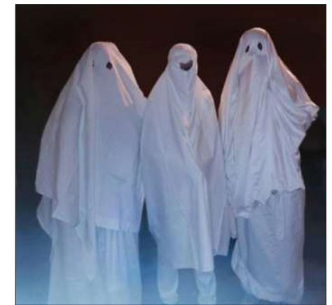
Angeblieh haben die Bücherei-Buddys drei Geister aufgeweckt...