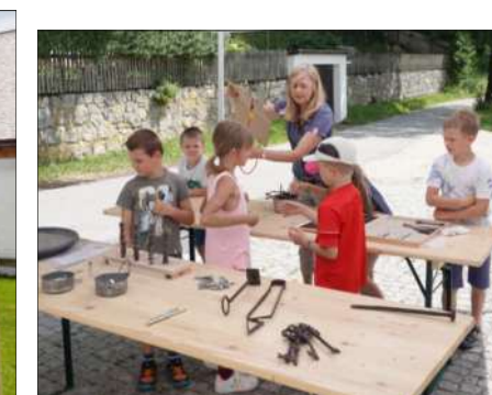
Wie arbeitete der Schmied? Was wurde hergestellt? Welche Personen waren von besonderer Bedeutung? (siehe Titelseite!) Wissenswertes und spielerische Stationen warteten auf die interessierten Kinder.