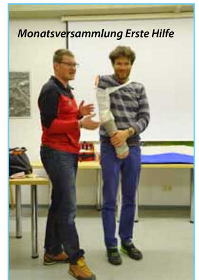
Monatsversammlung Erste Hilfe

touren unterwegs, so zum Beispiel mit den Anwärtern im Lechtal oder bei unserem Schitourenausflug, bei dem wir heuer am letzten Aprilwochenende auf der Amberger Hütte waren. Neben dem kameradschaftlichen Aspekt geben wir damit unseren Anwärtern Gelegenheit, die für ihre Ausbildung notwendigen Touren zu sammeln.