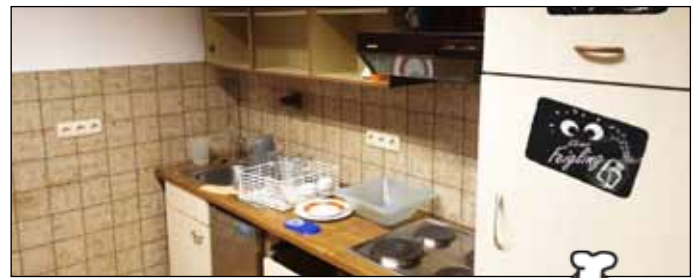
Die alte Küche hat ausgedient - die neue Küche wartet auf neue Chefs