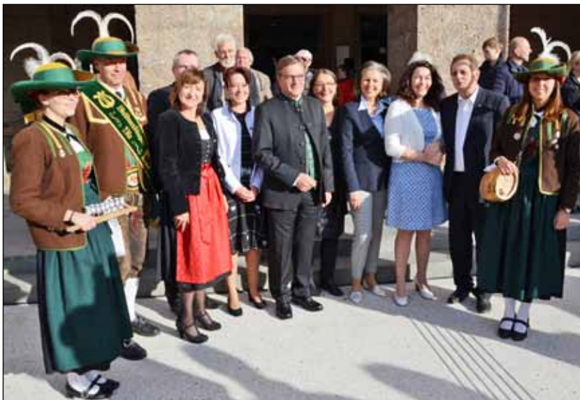
Eröffnung „Tag der offenen Tür im Landhaus“ durch die Stadtmusikkapelle Vils - dirigiert von LH Günther Platter