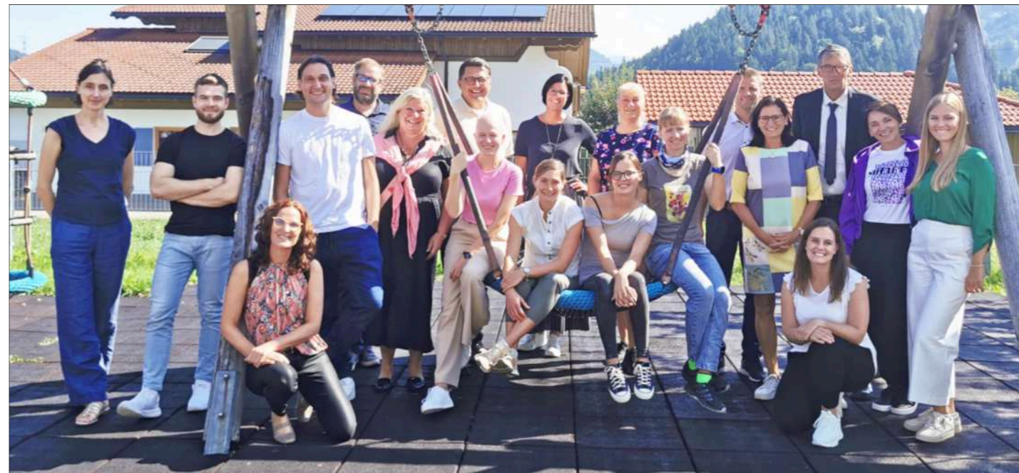
Die neuen Mitglieder der Schulgemeinschaft: