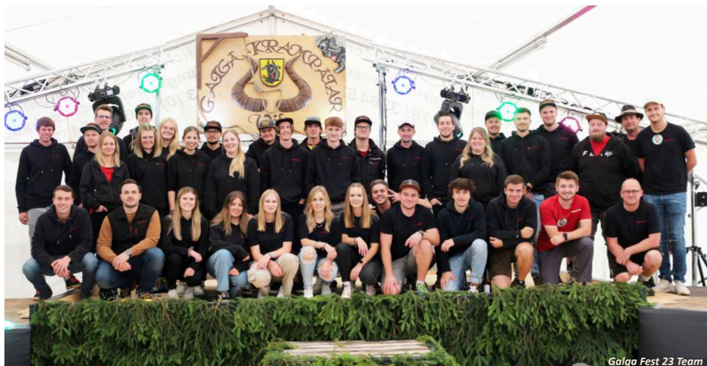
Galga Fest 23 Team