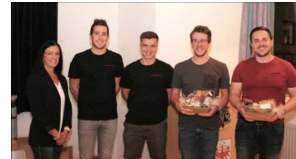
Dank an Fabian Tröbinger und Dominik Lochbihler