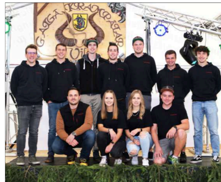
Ausschuss 2020 - 23