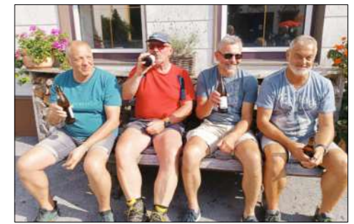
Die Altherrenrunde stellt zufrieden fest, dass für den Nachwuchs gesorgt ist.