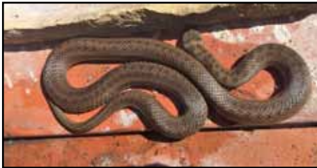
Diese Kreuzotter besuchte kürzlich die Hammerschmiede.