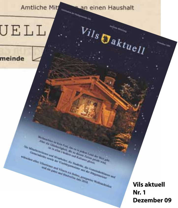
Vils aktuell Nr. 1 Dezember 09

Vieles passiert ohne dass es die Bewohnerinnen und Bewohner wissen. Dem wollen wir durch mehr Information entgegenreten und so vielleicht auch Ihr Interesse an der kommunalen Entwicklung wecken.