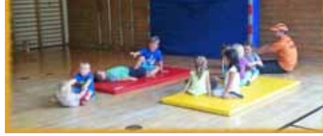
„Kinderturnen der Minis“ in der NMS Vils im November 2015

auf der Vereinshomepage. Gegenwärtig werden für das weitere Sportangebot neue motivierte Übungsleiter gesucht, die auch im Verein Qualifikationen im Gesundheits-sport, Ausdauersport sowie Kinder- und Jugendtraining erwerben können. (T/F: FW)