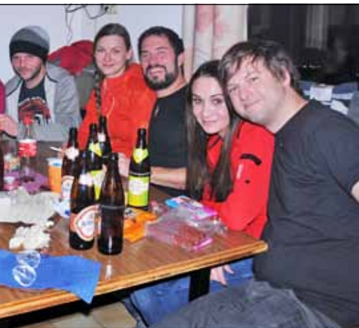
In Feierlaune: „Sportkugel“ und „Tschoooo“