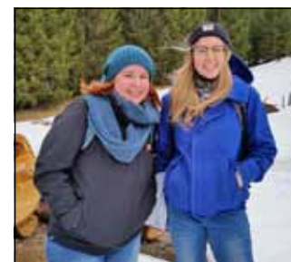
Auch die Schalengger haben ihre Groupies