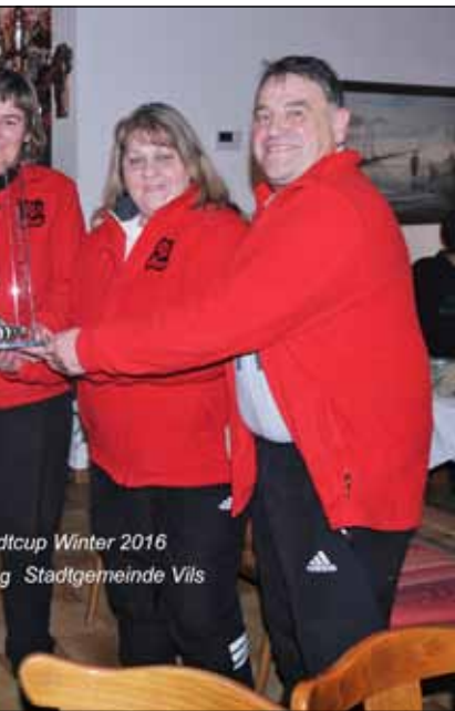
Stadtcup Winter 2016 Stadtgemeinde Vils

Jahr) an die Mannschaft „Gemeinde Vils“ geht. Rang 2 geht an den „Bandenzauber I“ und auf Platz 3 landete „Schwarzer Adler II“. Das „Team Highline Feat“ erkämpfte sich bei ihrem ersten Auftritt gleich Rang 4.