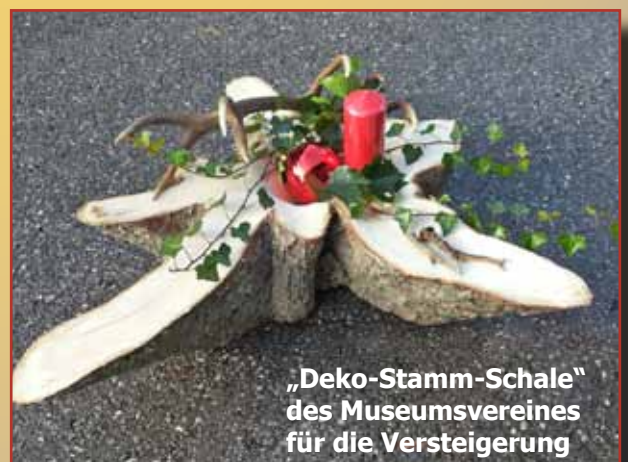
„Deko-Stamm-Schale“ des Museumsvereines für die Versteigerung