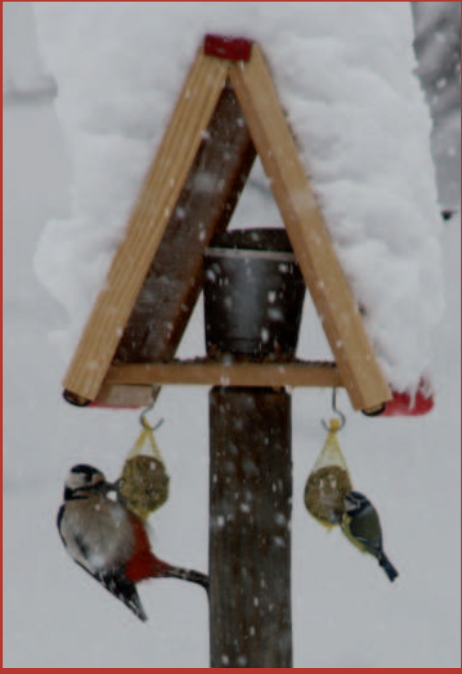
Ob der Buntspecht wohl 'ne Meise hat?