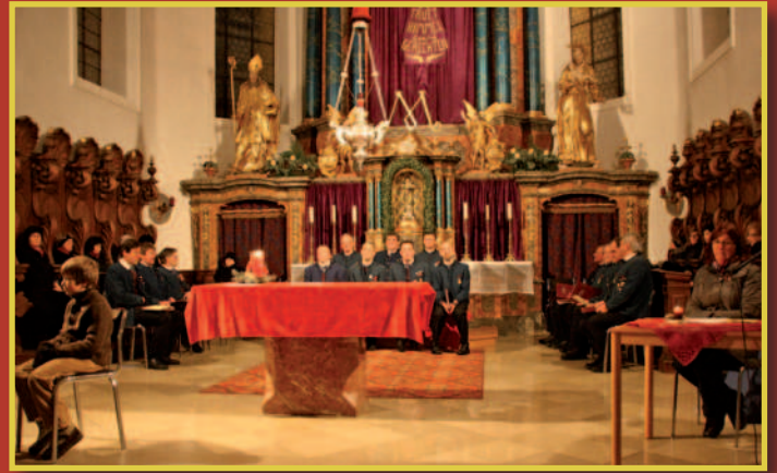
Adventsingen mit Krippenspiel

Dankeschön an alle, die die Advent- und Weihnachtszeit mit ihrem Engagement bereichern!