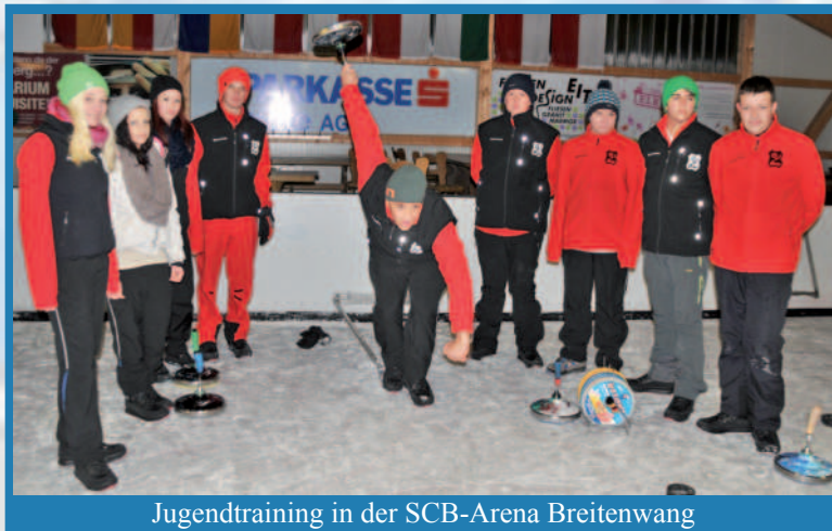
Jugendtraining in der SCB-Arena Breitenwang

Die abschließenden Neuwahlen (alle 2 Jahre) hielten dann auch einige Überraschungen parat. Mit Peter Stebele (Obmannstellvertreter), Sabrina Triendl (Schriftf. Stellvertreterin) und Dominik Kieltrunk (Platzwart) wurden 3 SSV-Jugendliche – mit viel Applaus und einstimmig – in den Ausschuss gewählt! Zudem erklärten sich weitere junge Stocksportler bereit, im administrativen Bereich (Homepage, Turnierauswertungen, usw.) mitzuwirken. Ein eindeutiges Signal dafür, dass die Jugend durchaus bereit ist, Verantwortung im Verein zu übernehmen! Die Weichen für die Zukunft des SSV Vils scheinen vorerst einmal gestellt. Neben den angestrebten sportlichen Zielen haben aber (wie bei allen Vilser Vereinen üblich) die Kameradschaft und das Miteinander von Jung und Alt oberste Priorität. Selbstverständlich sind auch „Nichtmitglieder“ und Feriengäste bei unseren Trainingsabenden und vereinsinternen Veranstaltungen jederzeit herzlich willkommen (Eisstöcke stehen zur Verfügung). In diesem Sinne wünscht der SSV Vils allen, die dem Verein nahe stehen, ein gesundes, erfolgreiches neues Jahr!