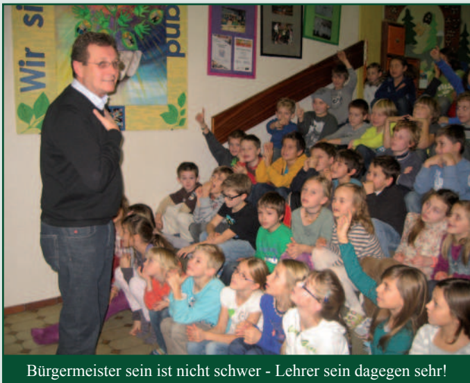
Bürgermeister sein ist nicht schwer - Lehrer sein dagegen sehr!