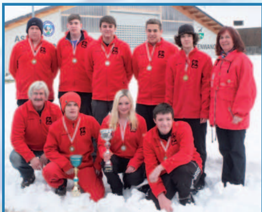
2. und 3. Platz bei der Tiroler Meisterschaft U19