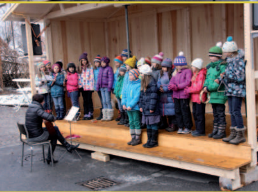
Die harte Vorbereitungszeit der „Kappenweiber“ auf den Weihnachtsmarkt